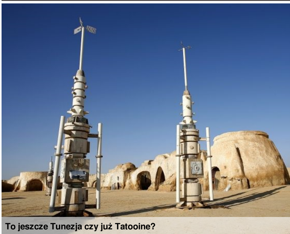
To jeszcze Tunezja czy już Tatooine?

Znaleźć się w świecie "Gwiezdných Wojen", na własne oczy zobaczyć dom Luke'a Skywalkerera czy gigantyczny las na Endorze? To marzenie każdego prawdziwego fana serii o Rebelii, Jedi oraz Imperium. Te marzenie da się zrealizować, bo niektóre te miejsca istnieją naprawdę!