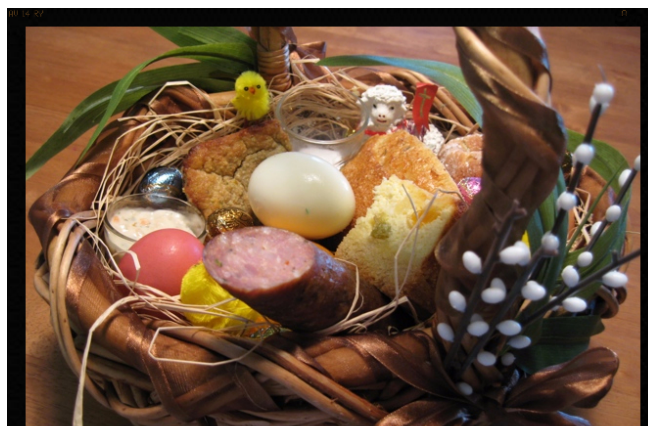
Koszyczek ze święconką.

W wiejskich chałupach gospodarze wygaszali stary ogień, by rozniecić nowy świecami zapalonymi od poświęconego, płonącego przy kościele ogniska. Dom, oborę i bydło skrapiali święconą wodą przyniesioną z kościoła.