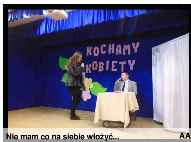
Nie mam co na siebie włożyć...

"Kobieta to jest coś, czego się nie da ogarnąć naszymi marnymi pięcioma zmysłami"