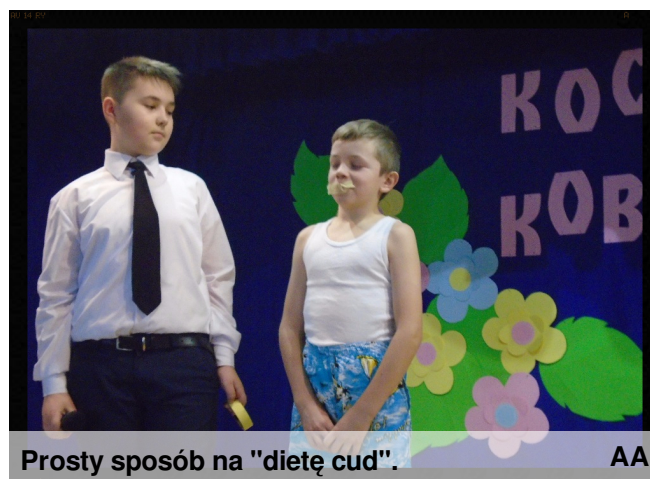
Prosty sposób na "dietę cud".

Święto wszystkich Pań (tych dużych i małych) uczciliśmy programem przygotowanym przez chłopców pod opieką Sławomira Oleksaka. Kabaretowy występ rozbawił wszystkich do łez. Nie zabrakło również serdecznych życzeń, kwiatów oraz miłych upominków przygotowanych przez brzydką pleć.