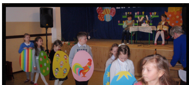
Czyż nie pięknie wyglądamy?