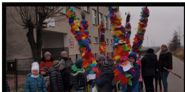
Z palmami przed szkołą.