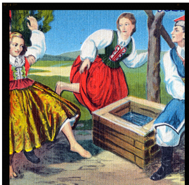
Mokro, oj mokro!!!

Z drugim dniem świąt związany jest obyczaj zwany „śmigusem-dyngusem” lub „lanym poniedziałkiem”. Nikomu nie mogło ujść na sucho. Wśród pisków, krzyków, szamotaniny i śmiechu najchętniej urządzano dyngus ładnym i lubianym pannom. Ta z dziewcząt, której nie oblano wiadrem wody albo nie wrzucono do rzeki, stawu czy chociażby koryta do pojenia bydła, czuła się obrażona. Aby wypędzić z ludzi wszelkie zło, bito się wierzbowymi różgami.