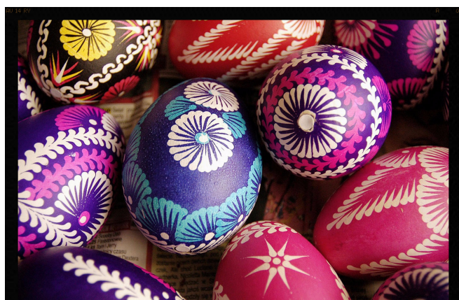
Magiczna moc pisanek.