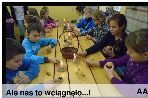
Ale nas to wciągnęło...!