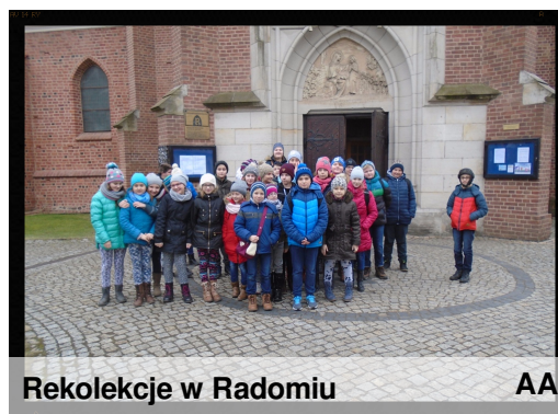
Rekolekcje w Radomiu