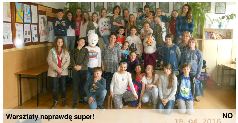
Warsztaty naprawdę super!