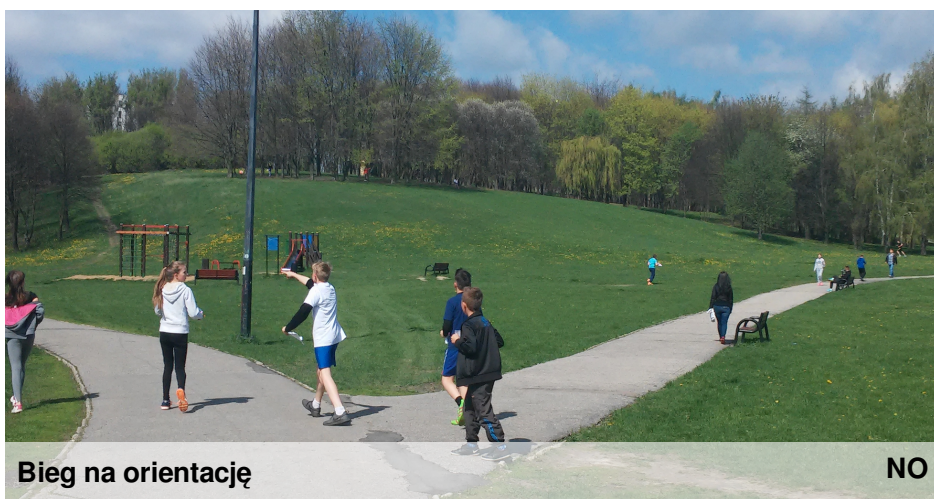
Bieg na orientację