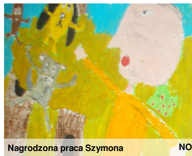
Nagrodzona praca Szymona