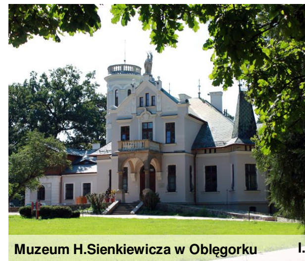
Muzeum H.Sienkiewicza w Oblęgorku

- Jako trzynastolatek opracował plan wyzwolenia Polski, opierający się na tym, że wszyscy Polacy powinni wyjechać do Ameryki, tam stworzyć armię i powrócić do kraju, by wyzwolić ojczyznę