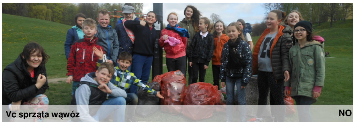
Vc sprząta wąwóz

20 kwietnia br. kilka klas z naszej szkoły wzięło udział w sprzątaniu okolicy naszej szkoły. Uczniowie klasy 2c, 4b, 5b, 5c oraz nasi koledzy z LO wybrali się do pobliskiego wąwozu. Śmieci było dużo, ale większość została posprzątana. Na pierwszy rzut oka można było zobaczyć różnicę przed i po sprzątaniu. Mamy nadzieję, że przez dłuższy czas będzie tam czysto. To była świetna zabawa.