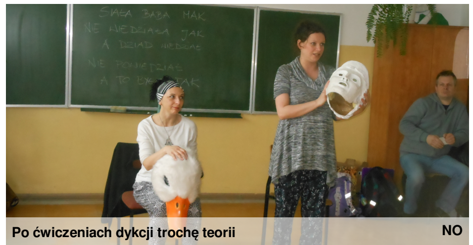
Po ćwiczeniach dykcji trochę teorii

Cieszymy się, że możemy oglądać spektakle teatralne - to nie tylko nauka, ale miła rozrywka.