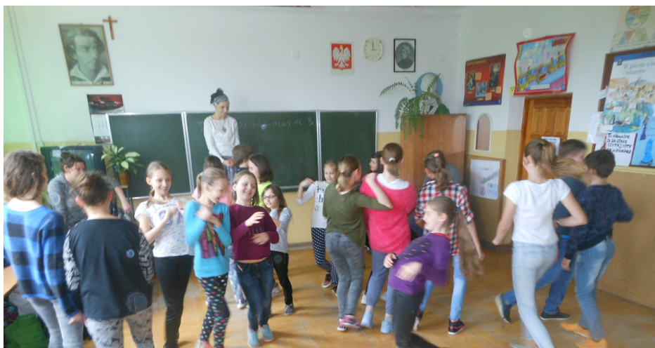
Teatr to jest to !

We wtorek całą klasą wybraliśmy się do CK UP na sztukę pt. "Przygody Tomka Sawyera" - adaptację powieści Marka Twaina, która jest naszą lekturą.