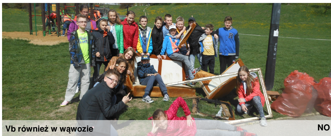
Vb również w wąwozie