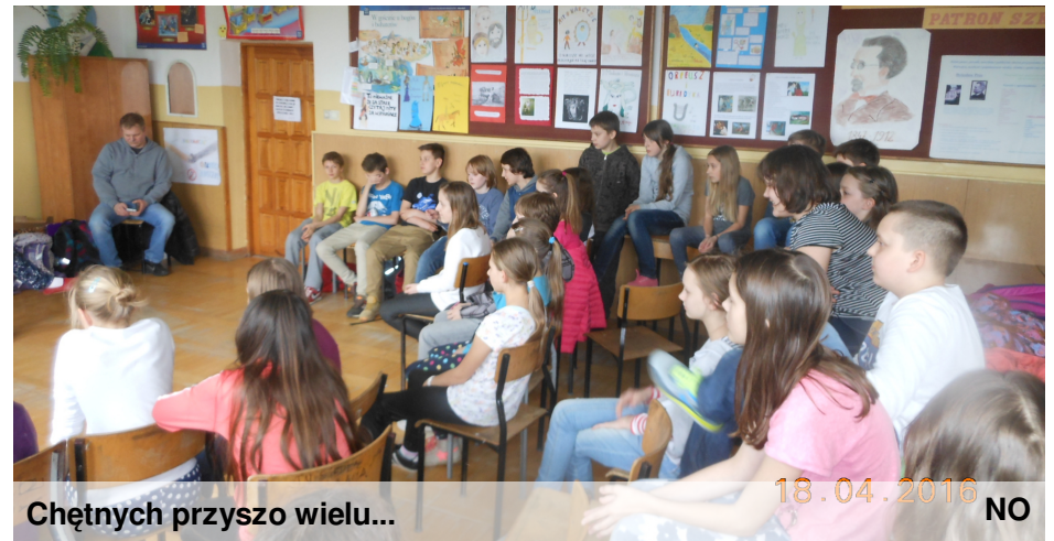
Chętnych przyszło wielu...