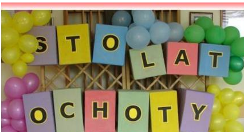
100 lat Ochoty