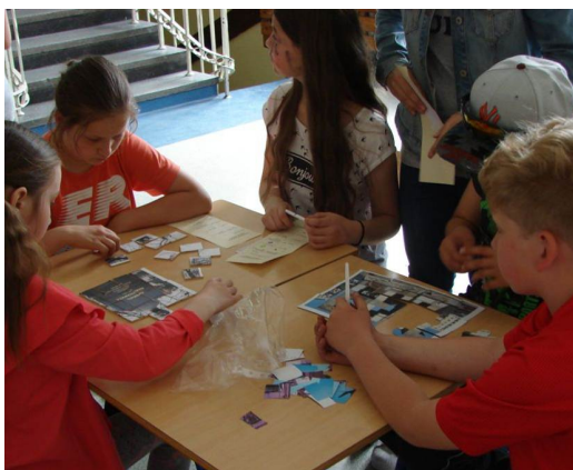
100 lat ochoty