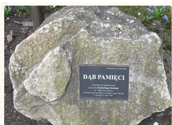
Kamień przy Dębie Pamięci