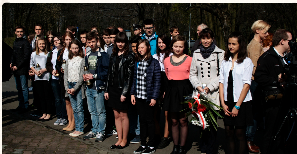
Przedstawiciele G1 na Placu Stosika