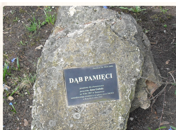
Kamień przy Dębie Pamięci