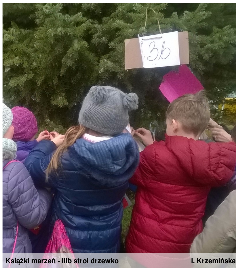
Książki marzeń - IIIb stroi drzewko