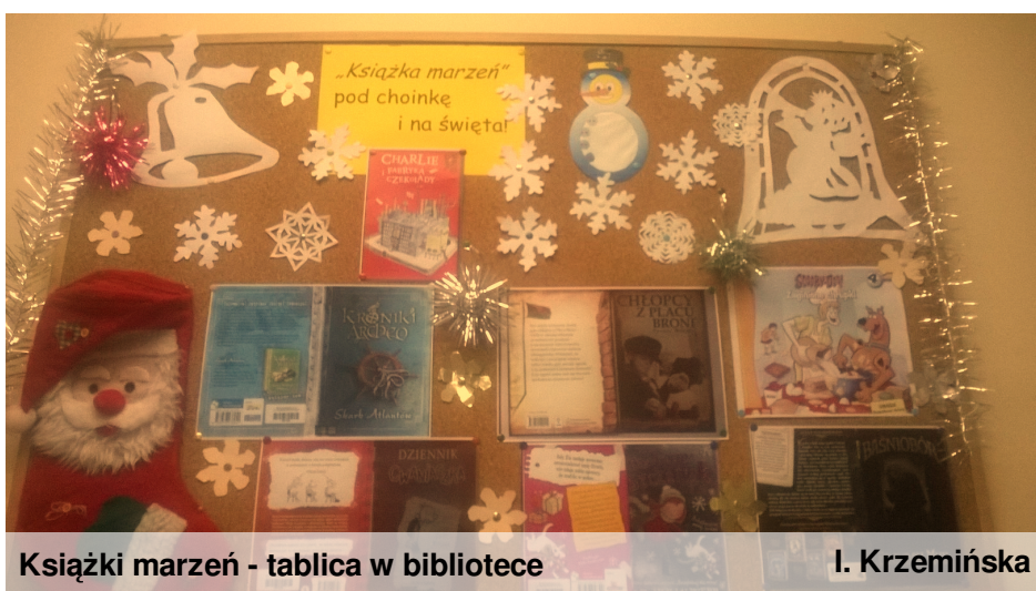
Książki marzeń - tablica w bibliotece