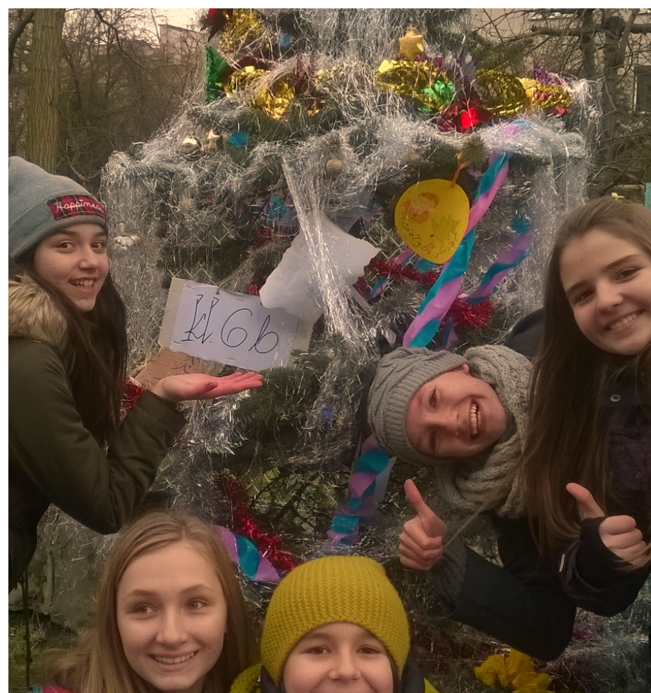
Drzewko klasy VIb