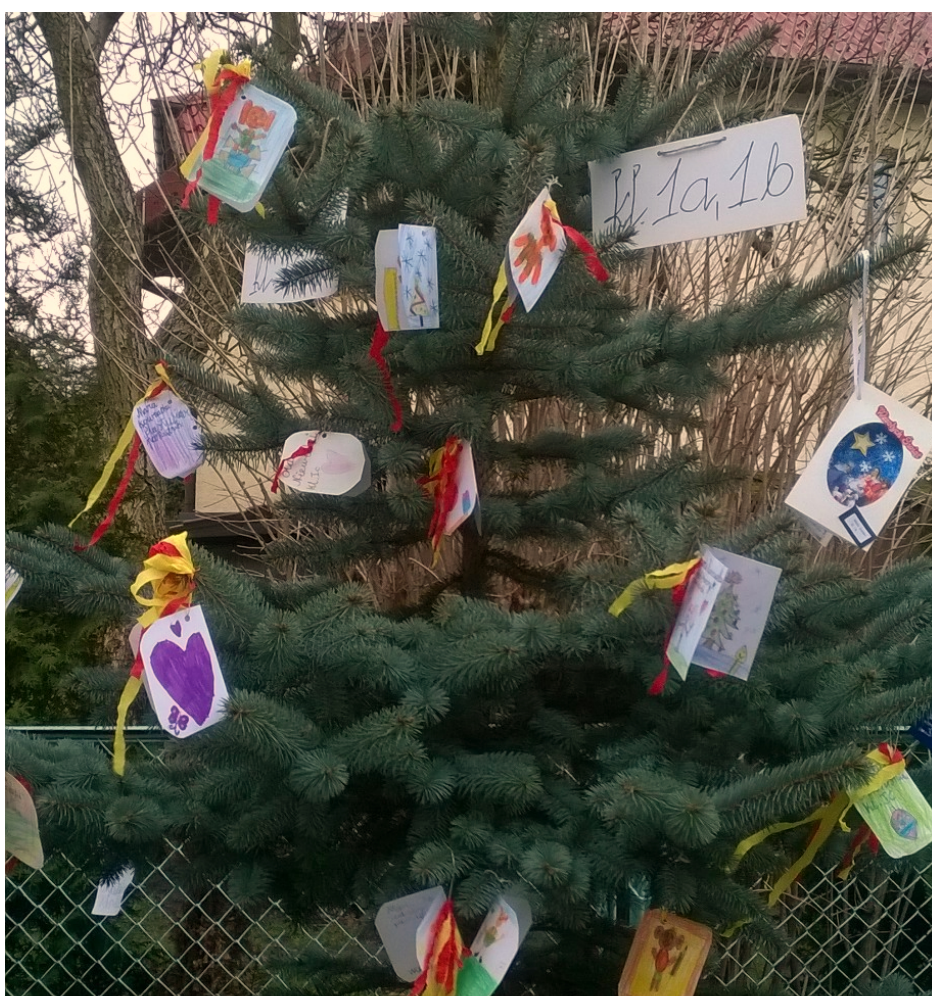
Drzewko klas pierwszych