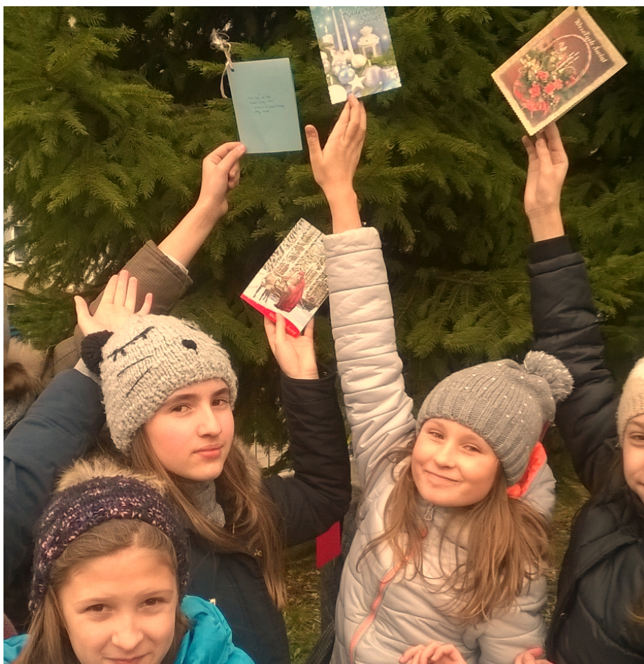
Książki marzeń - drzewko kl. Va