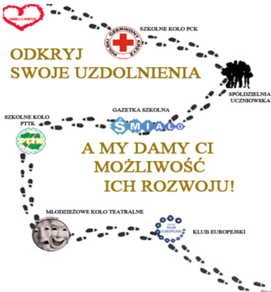
Mapa dla gimnazjalisty