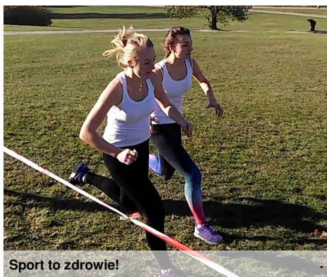
Sport to zdrowie!