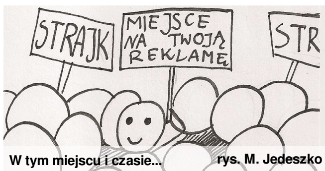
W tym miejscu i czasie...