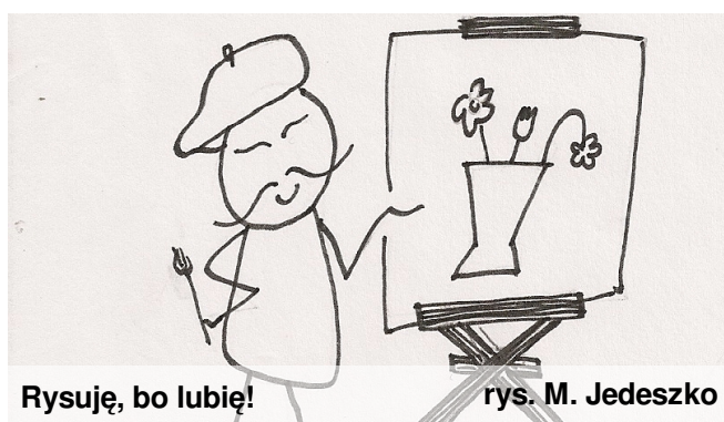
Rysuję, bo lubię!