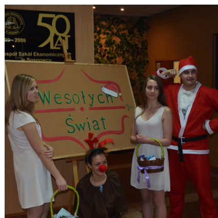
Mikołajki tylko u nas!