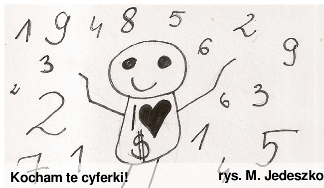
Kocham te cyferki!