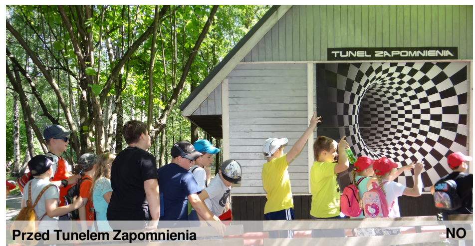
Przed Tunelem Zapomnienia

W dniu 10.06. 2016 roku wraz z klasą 1a pojechaliśmy na Farmę Iluzji. Pani przewodnik pokazała nam lewitujący kran. Następnie poszliśmy do labiryntu z bambusów. Potem byliśmy w Tunelu zapomnienia i pokonywaliśmy Zieloną Ścieżkę Zdrowia. Zrobiliśmy wiele śmiesznych zdjęć z "głową na talerzu". Widzieliśmy Meble Olbrzyma i Magiczny Domek. Odwiedziliśmy zamek, w którym na ścianie odbijały się nasze cienie. Poszliśmy do labiryntu z luster, krzywego domu, w którym kręciło się w głowie. Po tak wielu atrakcjach jedliśmy pyszny obiad i mieliśmy czas na kupowanie pamiątek. Mieliśmy jeszcze okazję skorzystać z dodatkowych atrakcji. Niektórzy skakali na trampolinach, a inni jeździli na dwukołowych Segway PT. Podczas pobytu wszyscy świetnie się bawili. Zespół dziennikarski z kl. 3a