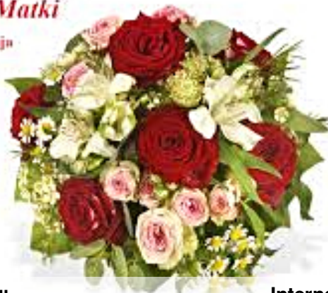
Bukiet dla mamy