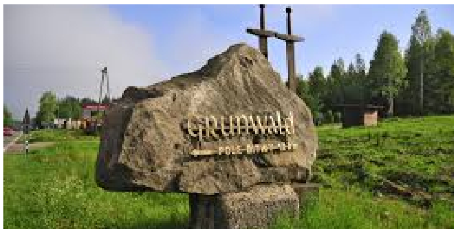
Tu pokonaliśmy Krzyżaków

Mazury nasze królestwo jezior, idealne miejsc na spędzenie tam wakacji. Atrakcją turystyczną jest Pole Bitwy – Grunwald, na którym w 1410 r. wojska polsko-litewskie pokonały Krzyżaków. Charakterystycznym elementem krajobrazu są cmentarze ewangelickie, a także aleje drzew. Mazury mają bardzo charakterystyczną architekturę domów. Budują domy ze spadzistymi dachami i umieszczają drzwi na najdłuższej ścianie domu. Ale główną atrakcją jest przecież kąpiel w jeziorach. Miłych wakacji!!!