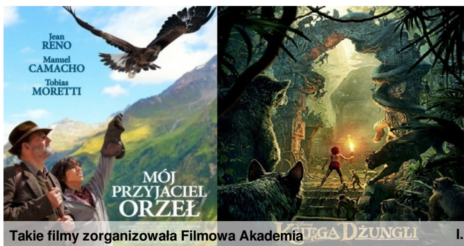
Takie filmy zorganizowała Filmowa Akademia I.