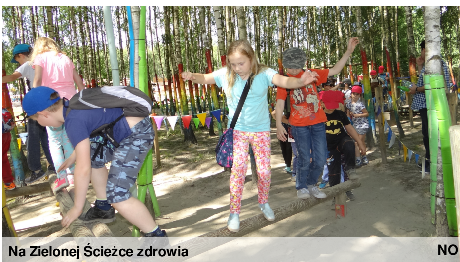
Na Zielonej Ścieżce zdrowia