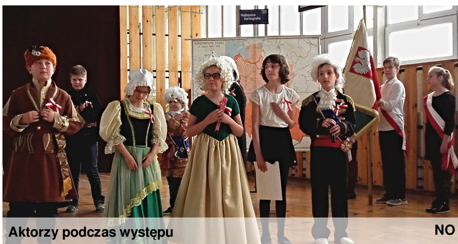
Aktorzy podczas występu