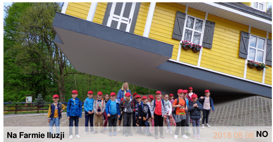
Na Farmie Iluzji