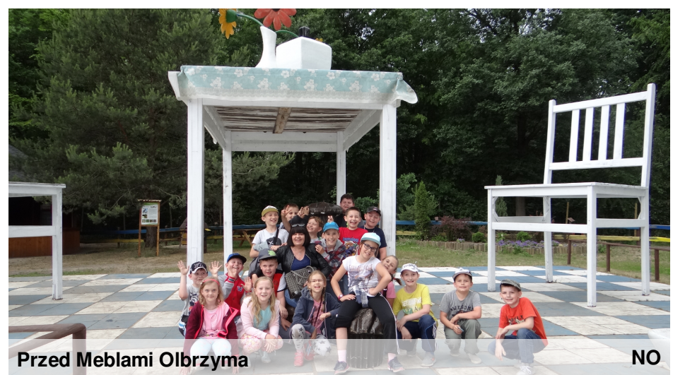
Przed Meblami Olbrzyma