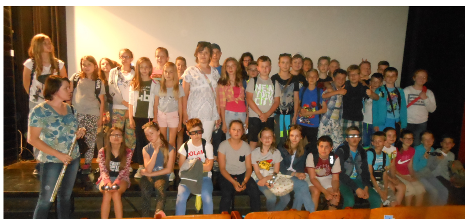
KL.Vb i Vb - MAF

Serdecznie gratulujemy wszystkim uczestnikom Konkursu talentów, gdyż jest to ogromny stres, a oni wytrzymali ciężar presji i pięknie nam się zaprezentowali. Życzymy Wam powodzenia w konkursie, który pewnie odbędzie się znów za rok!