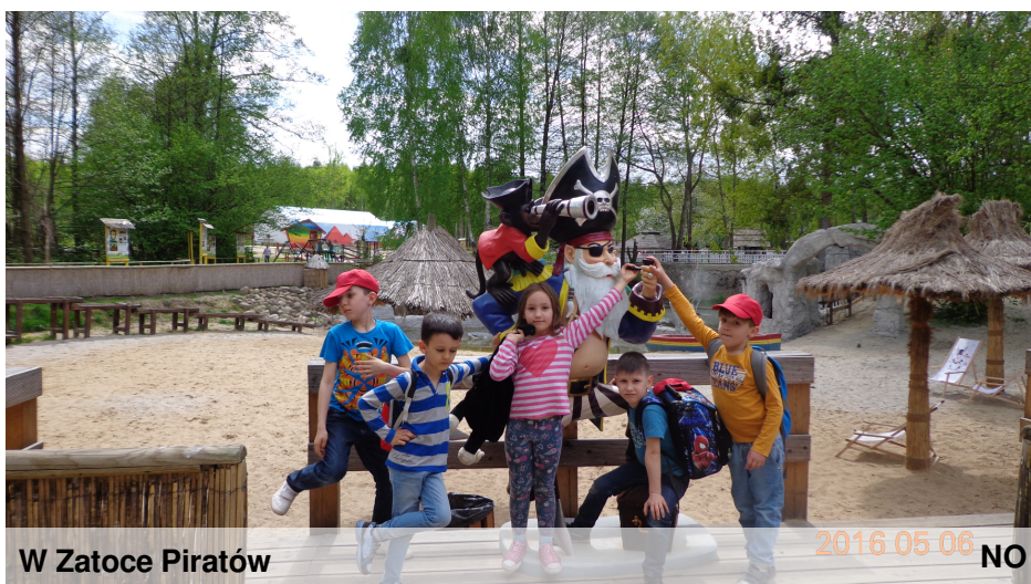
W Zatoce Piratów