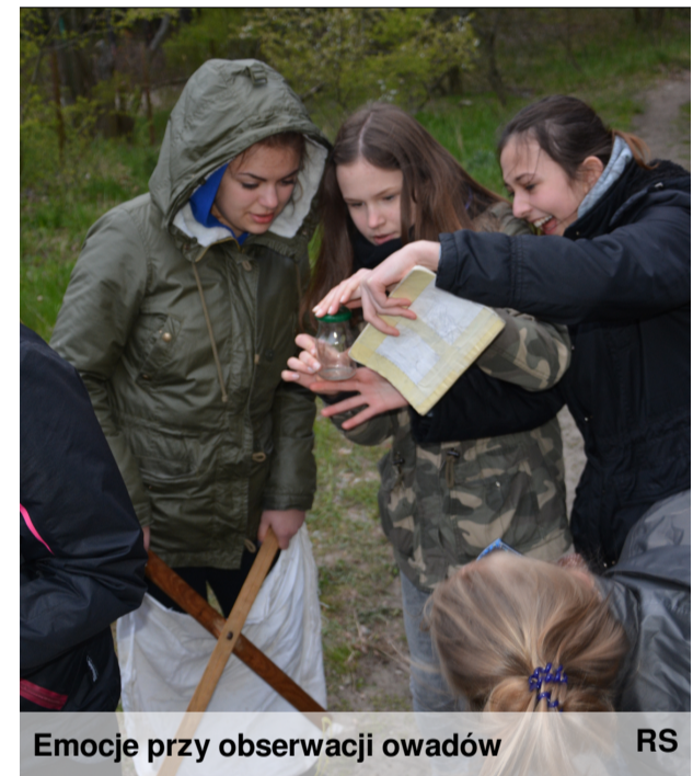
Emocje przy obserwacji owadów

W międzyczasie były spacerzy oraz wspólne gry i zabawy na plaży, a także dyskoteka i projekcja filmu oraz gry towarzyskie. Pięć dni Zielonej Szkoły bardzo szybko upłynęły w miłej atmosferze.