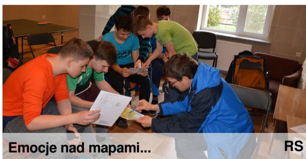
Emocje nad mapami...