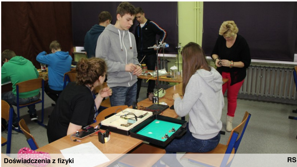
Doświadczenia z fizyki