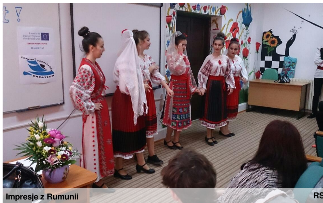
Impresje z Rumunii

Wczesnym rankiem w niedzielę 8 maja 2016 roku na gdańskim lotnisku spotkało się 12 uczniów naszego gimnazjum i ich 4 opiekunów, aby wyruszyć do Rumunii.