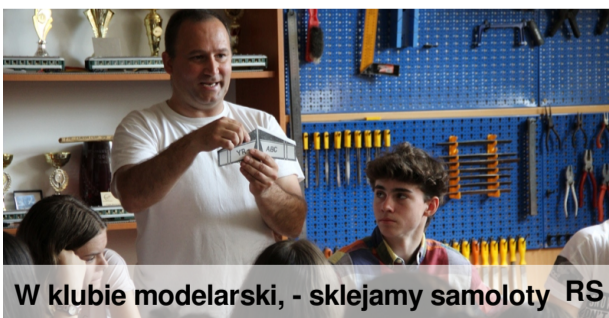
W klubie modelarski, - sklejamy samoloty