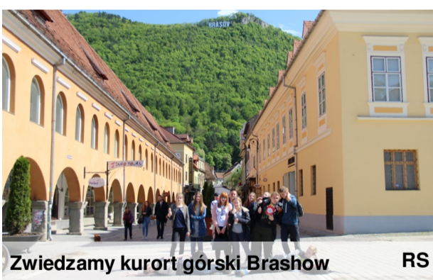
Zwiedzamy kurort górski Brashow

Ostatniego dnia zajęć związanych z projektem odbyły się ostateczne przygotowania do debaty oraz próba debaty pod hasłem „Latanie jest przyszłością”, podczas której ściśle współpracowaliśmy z uczniami z Turcji i Rumunii.