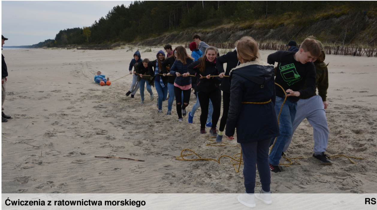
Ćwiczenia z ratownictwa morskiego