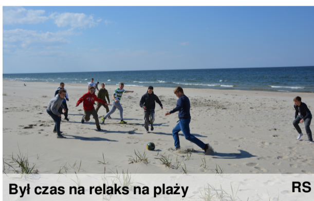
Był czas na relaks na plaży