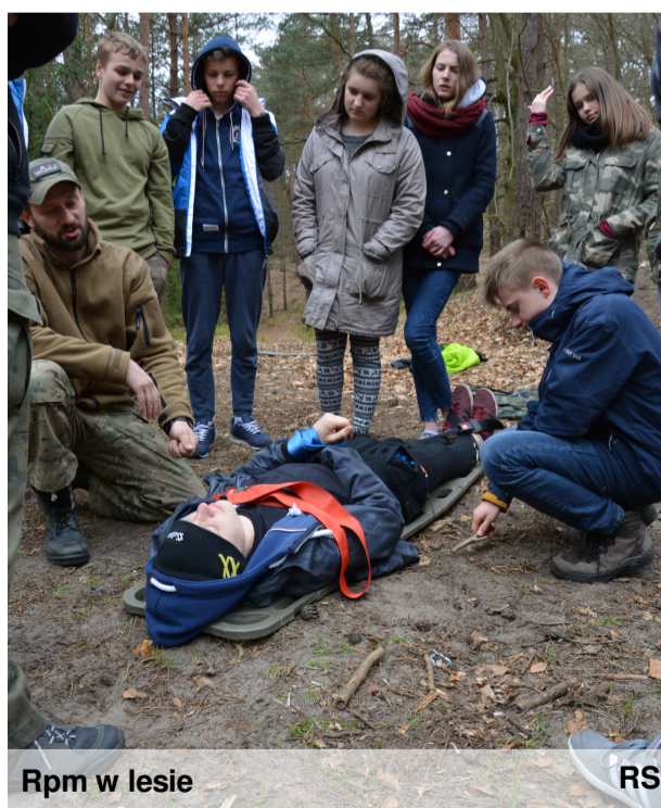
Rpm w lesie