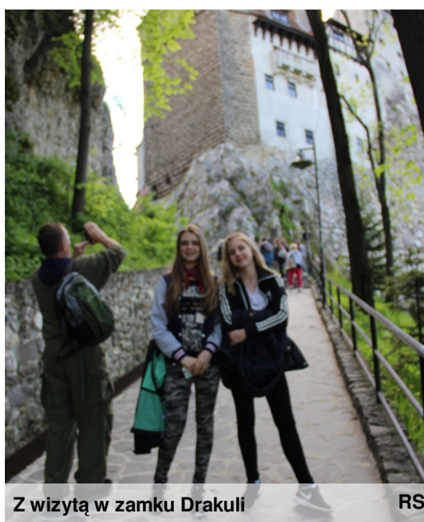
Z wizytą w zamku Drakuli