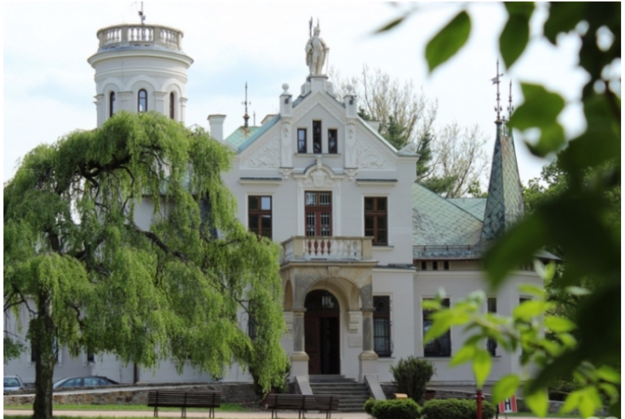
Muzeum w Oblęgorku

Muzeum w Oblęgorku istnieje od 1958 roku. Powstało dzięki patronatowi Ministerstwa Kultury i Sztuki i ofiarności wielu ludzi, w tym przede wszystkim rodziny Sienkiewiczów. Mieści się niedaleko Kielc, w pałacyku w Oblęgorku, który był darem od narodu dla Henryka Sienkiewicza. Muzeum udostępnia zwiedzającym zachowane wnętrza gabinetu, salonu, sypialni, jadalni i palarni. Muzeum zgromadziło dużą liczbę oryginalnych przedmiotów należących kiedyś do pisarza oraz wiele unikatowych dokumentów bezpośrednio z nim związanych. Niezwykle ciekawy i okazały jest zbiór fotografii Sienkiewicza i jego najbliższych. Ważną częścią inwentarza są listy, rysunki i rękopisy. W kolekcji muzealnej cenne są zarówno portrety rodzinne, jak i ilustracje do jego dzieł. To świętokrzyskie muzeum posiada największą w Polsce kolekcję darów, albumów i adresów jubileuszowych, ofiarowanych Sienkiewiczowi z okazji 25-lecia pracy literackiej w 1900 roku, które są dowodem uznania, podziwu i czci dla talentu pisarza.