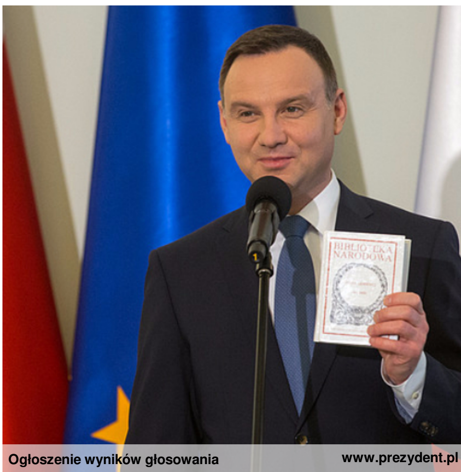
Ogłoszenie wyników głosowania