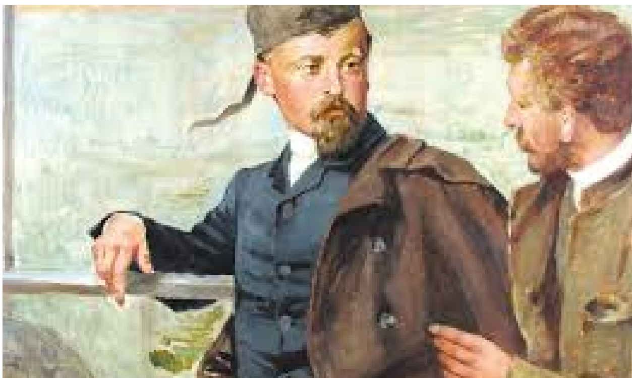
Henryk Sienkiewicz i Kazimierz Pochwaliński na statku