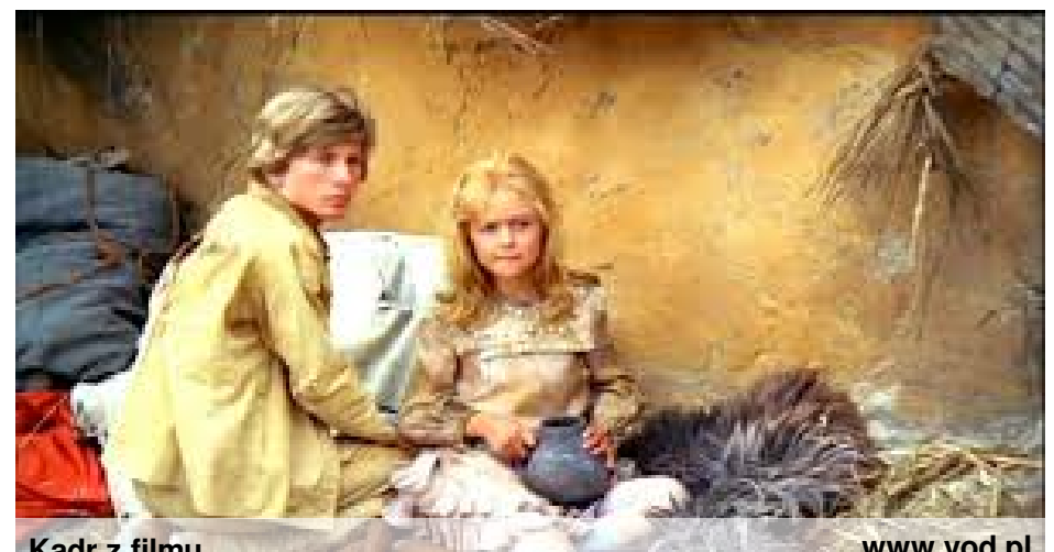
Kadr z filmu