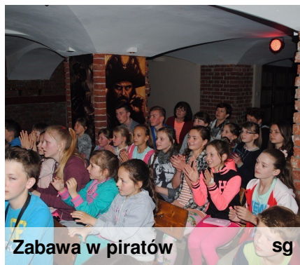
Zabawa w piratów