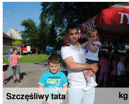
Szczęśliwy tata kg

W Niemczech – w dniu uroczystości Wniebowstąpienia Pańskiego, który przypada na 39. dzień po Niedzieli Wielkanocnej. W naszej szkole świętujemy razem z Dniem Matki podczas pikniku rodzinnego.