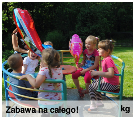
Zabawa na całego! kg

W Polsce i innych byłych państwach socjalistycznych Międzynarodowy Dzień Dziecka obchodzony jest od 1950 w dniu 1 czerwca. Po raz pierwszy zorganizowano go w związku z akcją zbierania podpisów pod apelem sztokholmskim. Od 1952 stało się świętem stałym. Jego inicjatorem jest organizacja zwana International Union for Protection of Childhood, której celem było zapewnienie bezpieczeństwa dzieciom z całego świata. Od 1994 tego dnia w Warszawie obraduje Sejm Dzieci i Młodzieży. Z okazji Dnia Dziecka w szkołach często obchodzony jest dzień sportu; np. poprzez organizowanie rozgrywek międzyklasowych. W naszej szkole obchodzimy to święto podczas pikniku rodzinnego, który odbywa się w maju lub w czerwcu od kilku lat.