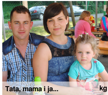
Tata, mama i ja... kg

Dzień Matki – święto obchodzone corocznie jako wyraz szacunku dla wszystkich matek. Data obchodów Dnia Matki zależy od kraju, w którym jest świętowany. W Polsce obchodzone jest 26 maja. W tym dniu matki są zwykle obdarowywane laurkami, kwiatami oraz różnego rodzaju prezentami przez własne dzieci, rzadziej inne osoby. To święto ma na celu okazanie matkom szacunku, miłości i podziękowania za trud włożony w wychowanie. Początki święta sięgają czasów starożytnych Greków i Rzymian. Kultem otaczano wtedy matki - boginie, symbole płodności i urodzaju. Naszym mamom składamy życzenia podczas pikniku rodzinnego w maju lub w czerwcu.