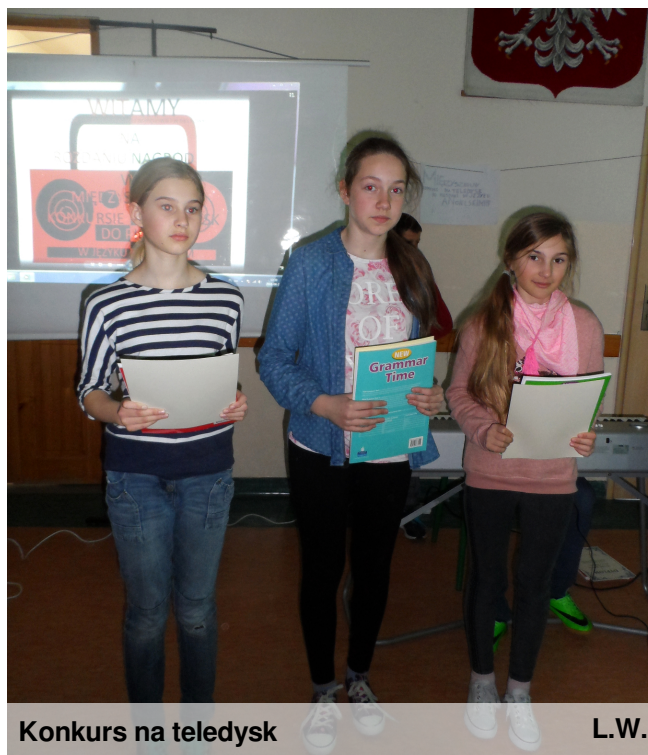
Konkurs na teledysk