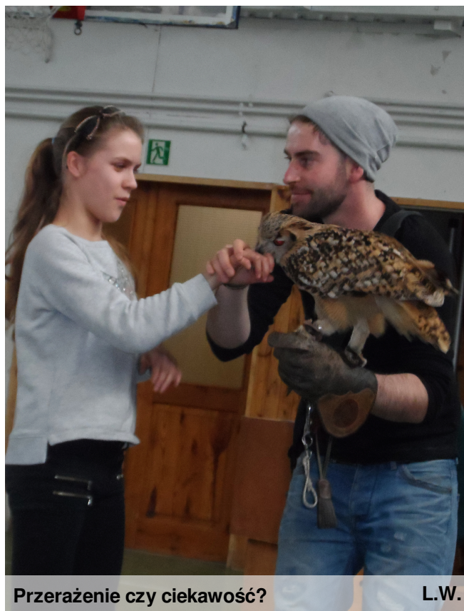
Przerażenie czy ciekawość?