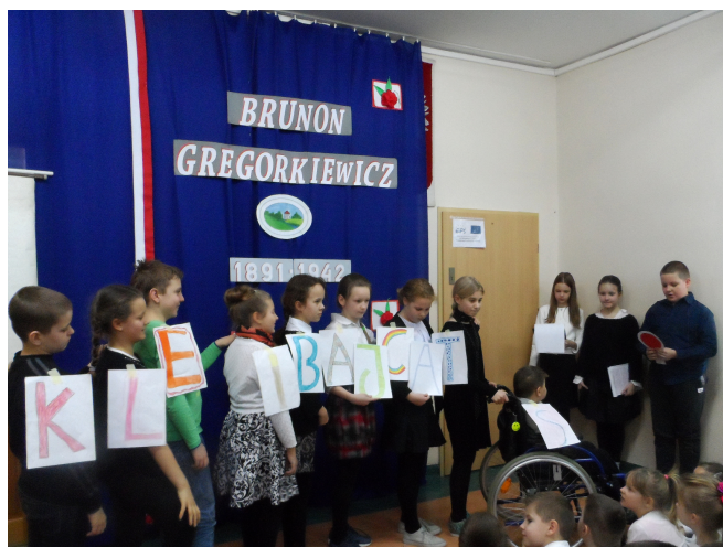
Scenka o patronie: kl. IV