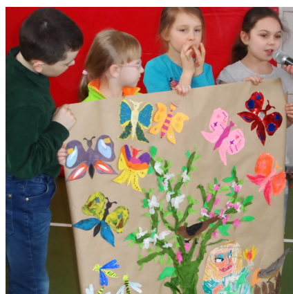
Wiosna w kl. IIa