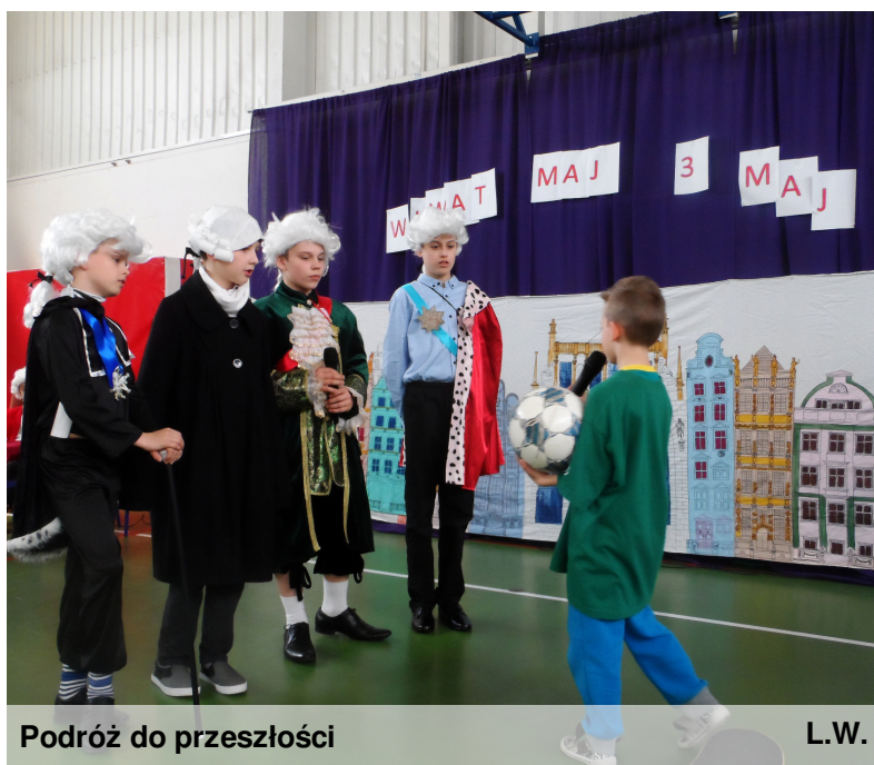
Podróż do przeszłości