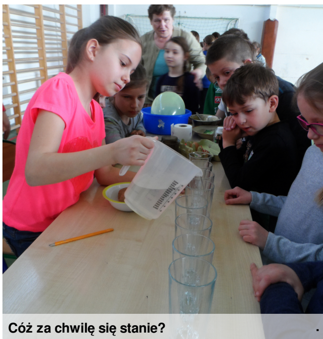
Cóż za chwilę się stanie?