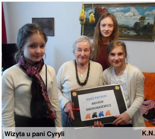
Wizyta u pani Cyryli