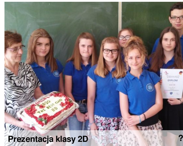
Prezentacja klasy 2D

Oprócz tego wszystkie klasy przygotowały krótką prezentację dotyczącą wylosowanego przez nich państwa - Chin, Rosji, Grecji, Hiszpanii lub Francji. Wszystkie prezentacje były świetne, ale jury wybrało najlepszy występ i znów była to klasa 2D . Gratulujemy ponownie!