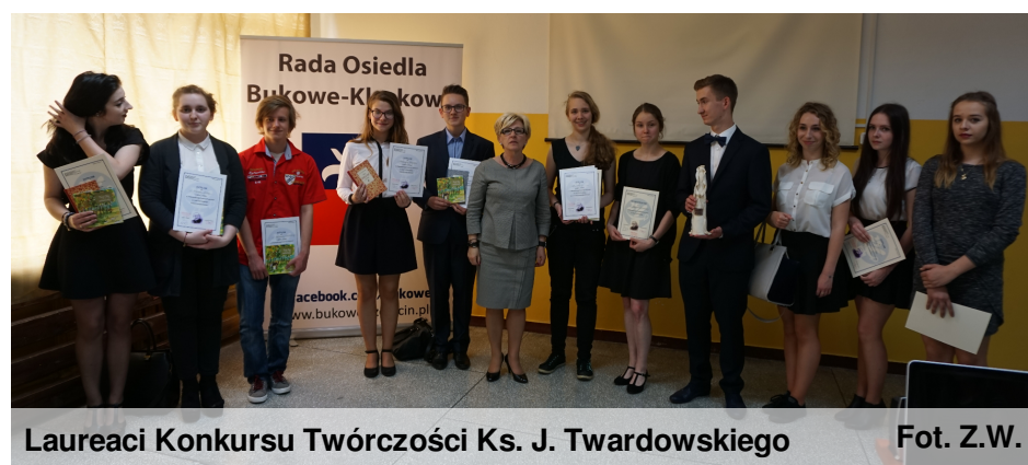
Laureaci Konkursu Twórczości Ks. J. Twardowskiego