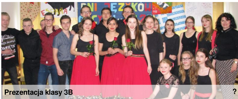
Prezentacja klasy 3B

Z niecierpliwością czekamy co takiego przygotowują dla nas nauczyciele w przyszłym roku!