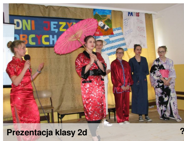
Prezentacja klasy 2d