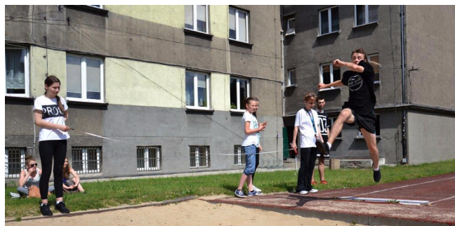
Citius Altius Fortius - RIO CZEKA!