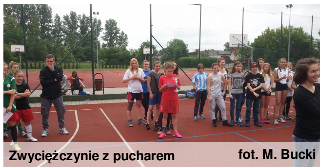
Zwycięzynie z pucharem