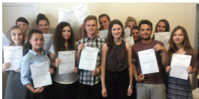
Nasi z certyfikatami