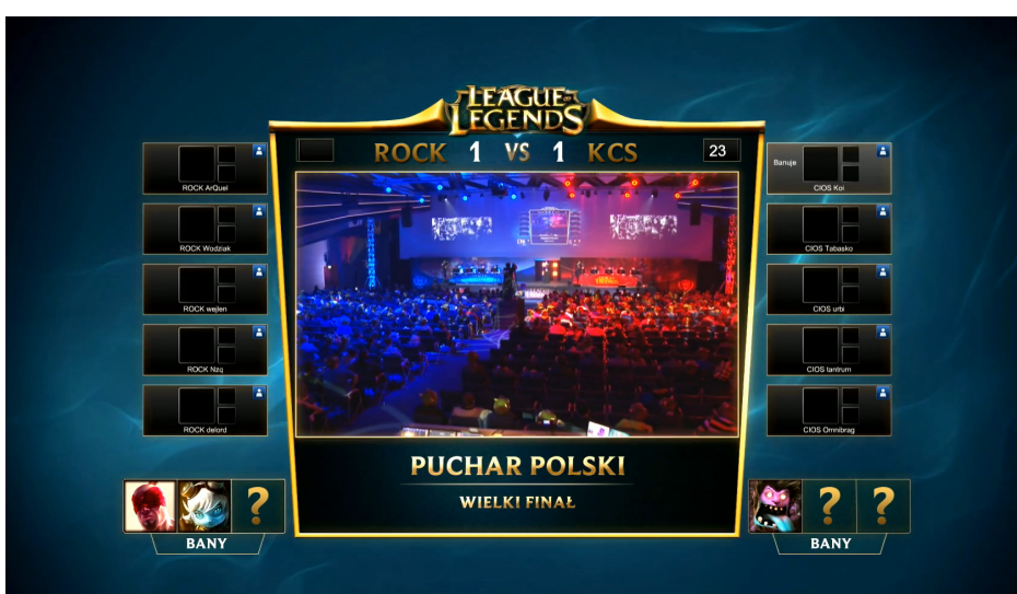
PUCHAR POLSKI - finał