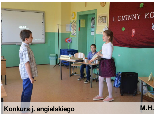
Konkurs j. angielskiego