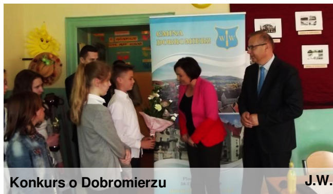
Konkurs o Dobromierzu