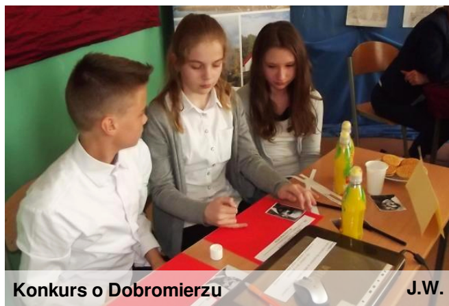
Konkurs o Dobromierzu