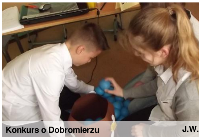
Konkurs o Dobromierzu