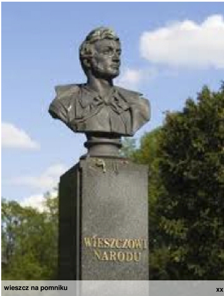
wieszcz na pomniku