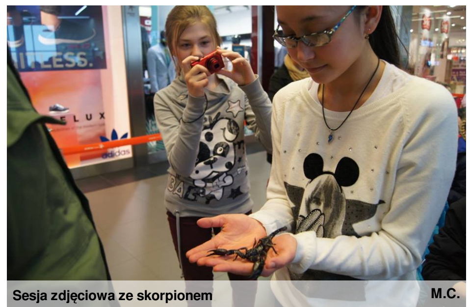
Sesja zdjęciowa ze skorpionem