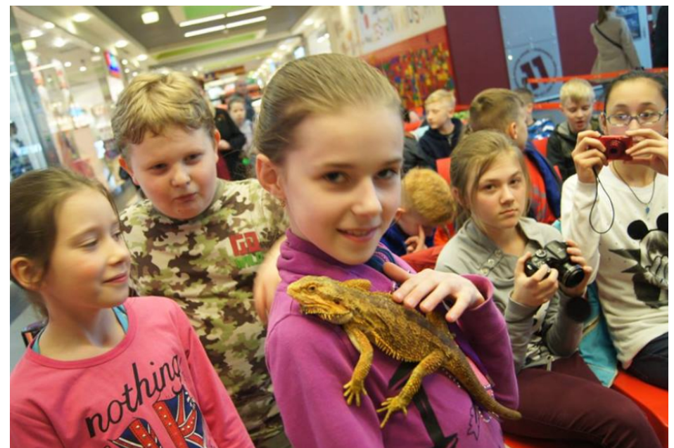
Nawet jaszczurka jest modelką