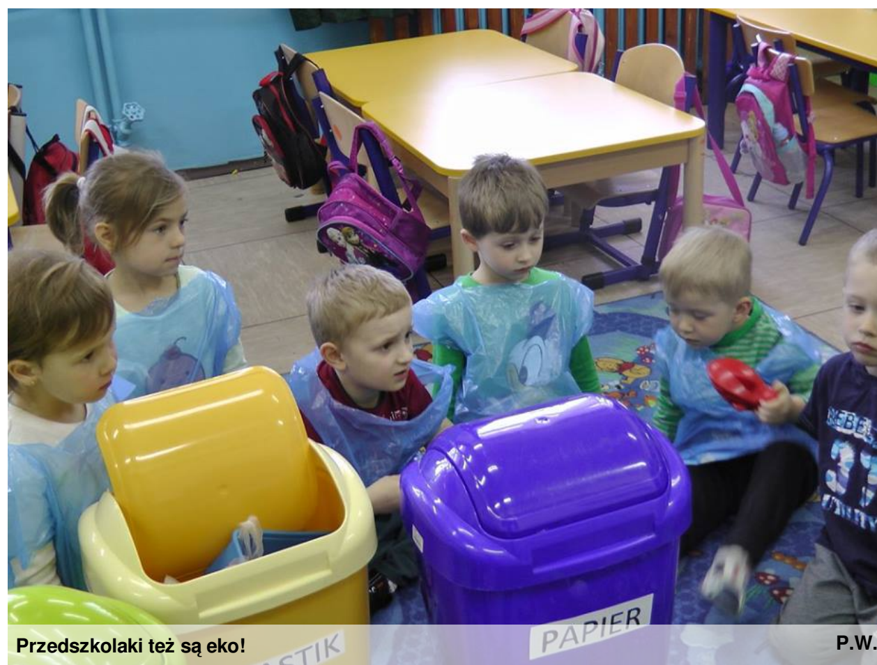
Przedszkolaki też są eko!