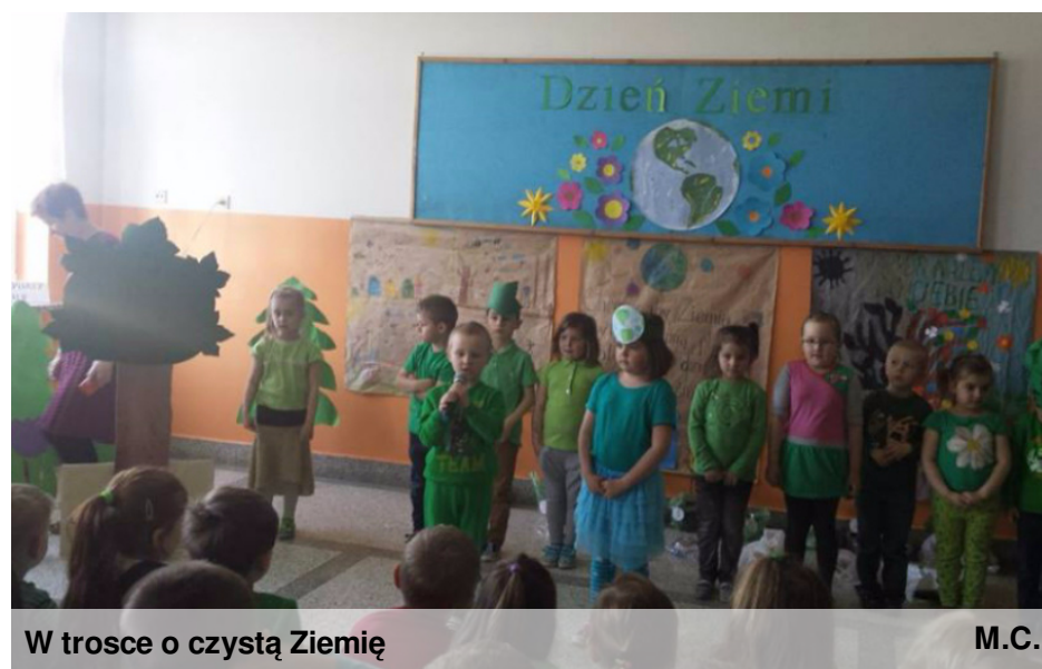
W trosce o czystą Ziemię