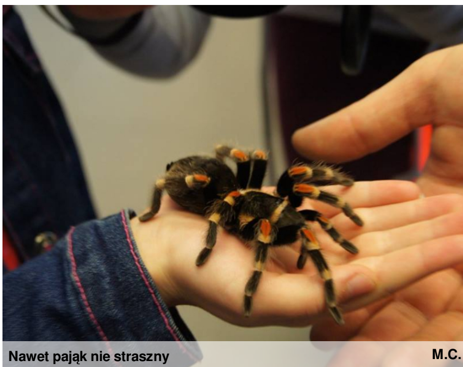
Nawet pająk nie straszny