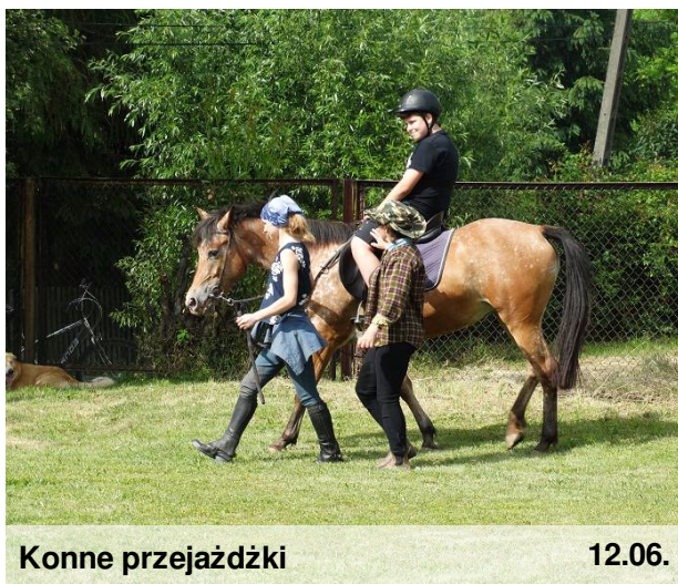
Konne przejażdżki 12.06.