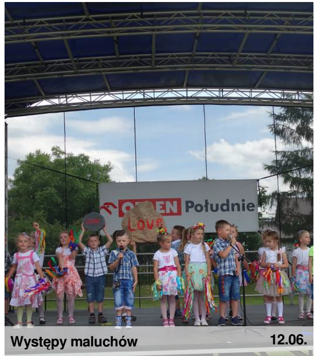
Występy maluchów 12.06.