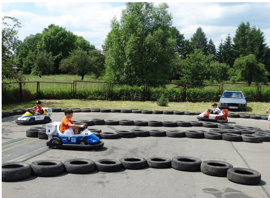
W oczekiwaniu na wakacje