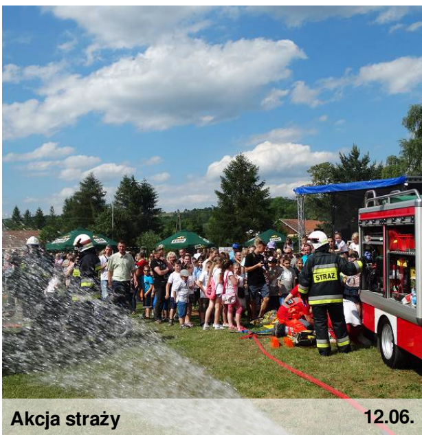
Akcja straży 12.06.