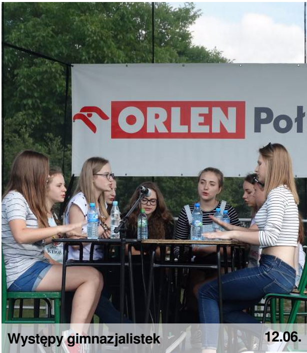
Występy gimnazjalistek 12.06.