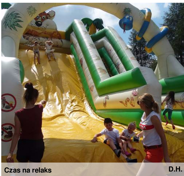
Czas na relaks