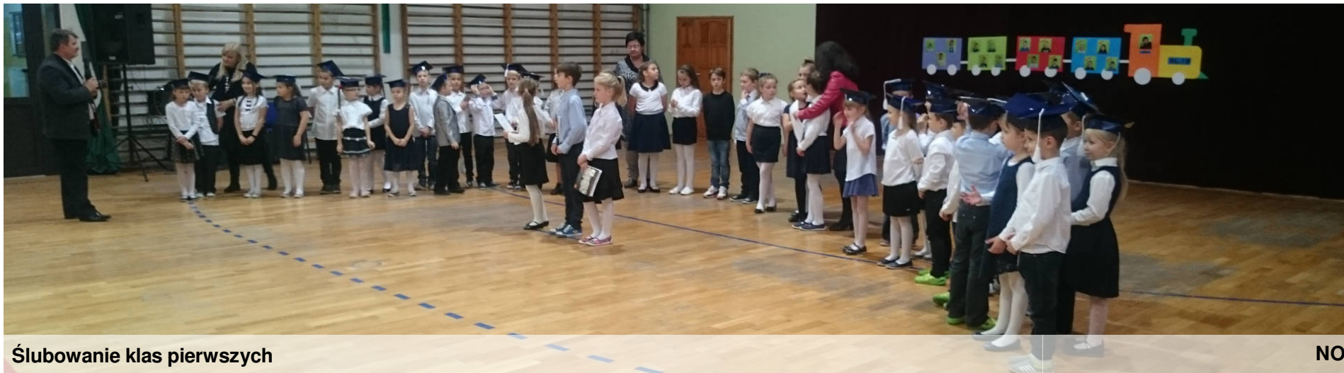
Ślubowanie klas pierwszych