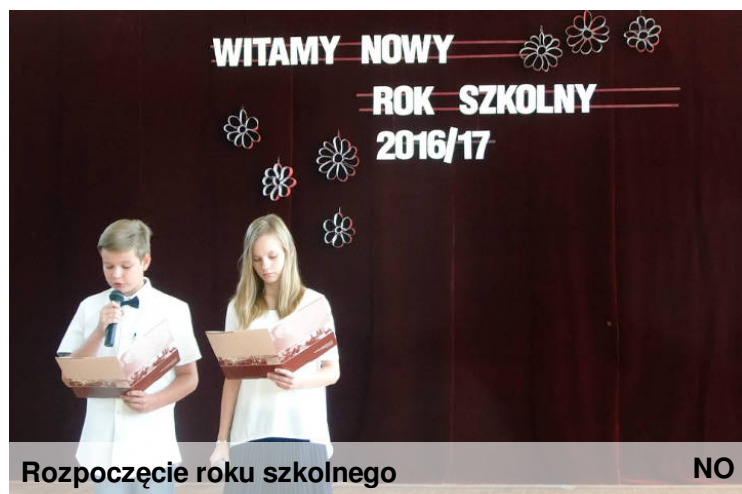
Rozpoczęcie roku szkolnego

Życzymy Wam sukcesów oraz aby ten rok szkolny upłynął Wam tak szybko, jak upłynęły Wam wakacje.