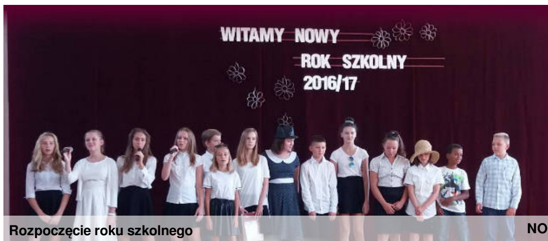
Rozpoczęcie roku szkolnego