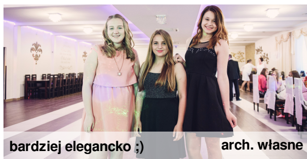
bardziej elegancko ;)