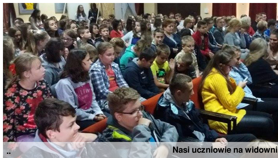
Nasi uczniowie na widowni