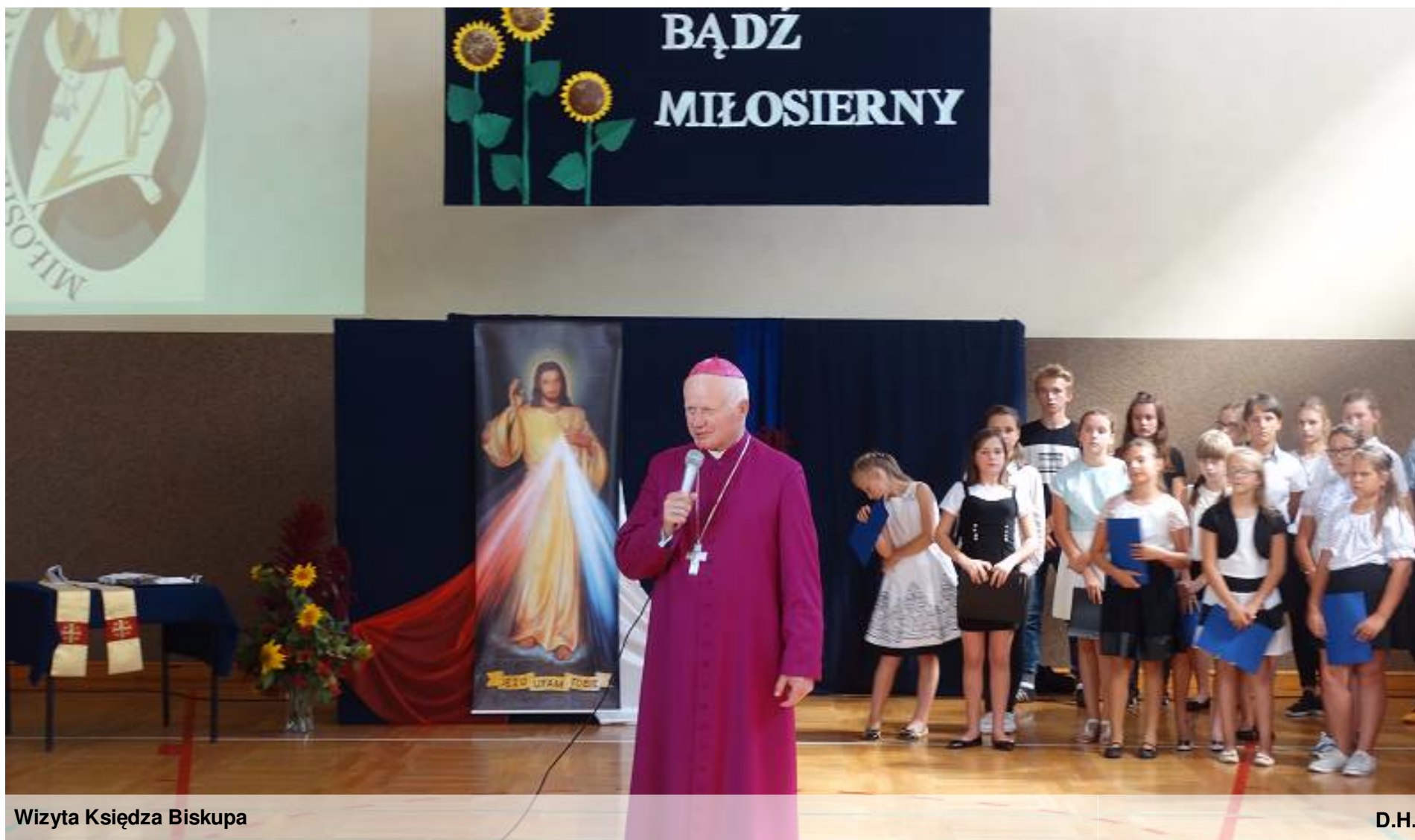
Wizyta Księdza Biskupa