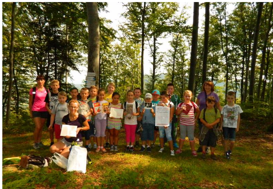
Czytanie na łonie natury