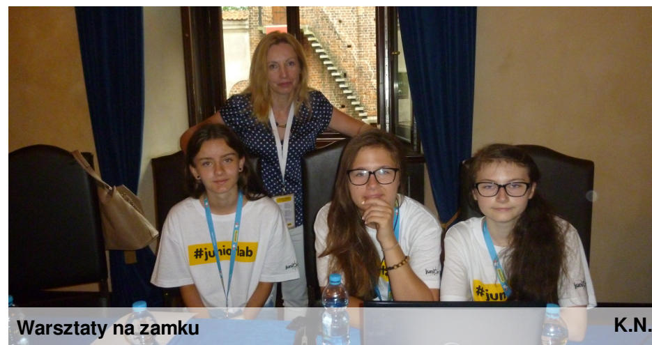
Warsztaty na zamku