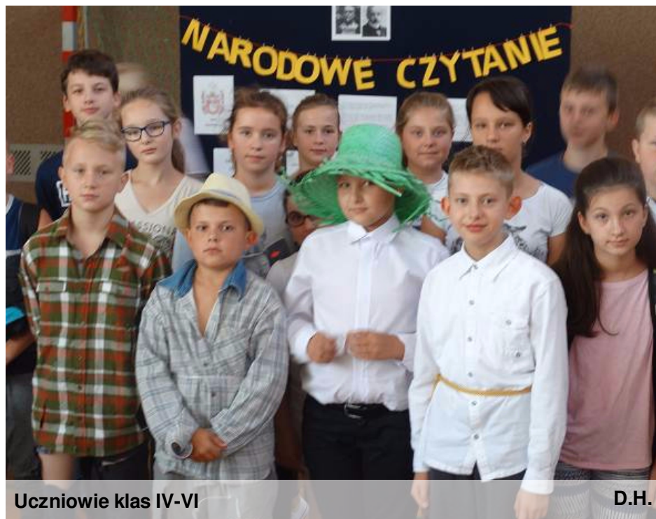
Uczniowie klas IV-VI