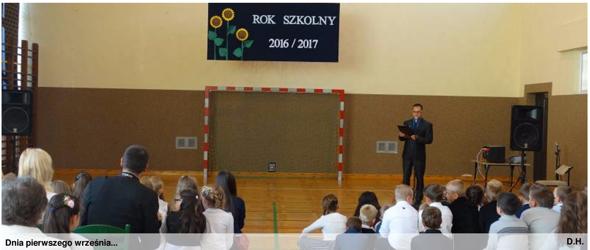
Dnia pierwszego września...