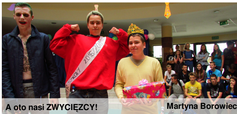
A oto nasi ZWYCIĘZCY!