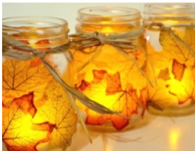
jesienny świecznik http://sparkandchemistry.com/

Potrzebne ci będą: słoik, pędzel, klej do decoupage Mod Podge, liście. Upewnij się, że słoik jest czysty. Liście nie będą się trzymały na brudnej powierzchni. Następnie sprawdź, czy liście są elastyczne. Jeżeli wybrałeś te prawdziwe, możesz je lekko zwilżyć dla giętkości. Później zanurz pędzel w Mod Podge i namaluj cienką warstwę na słoiku (zewnątrzną ścianką). Zaczynaj przyklejać od centrum liścia, a następnie palcami doklej jego krawędzie. Tym sposobem obklej cały słoik. Po wyschnięciu możesz włożyć do niego świeczki.