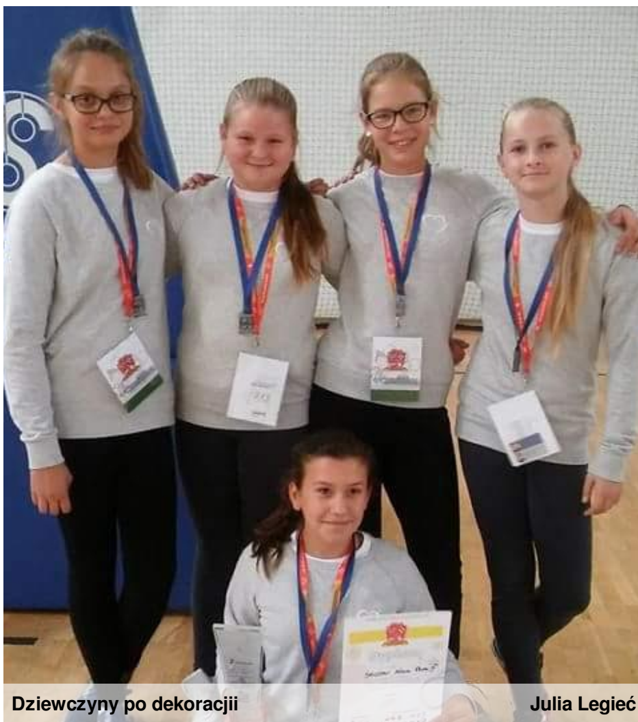
Dziewczyny po dekoracji