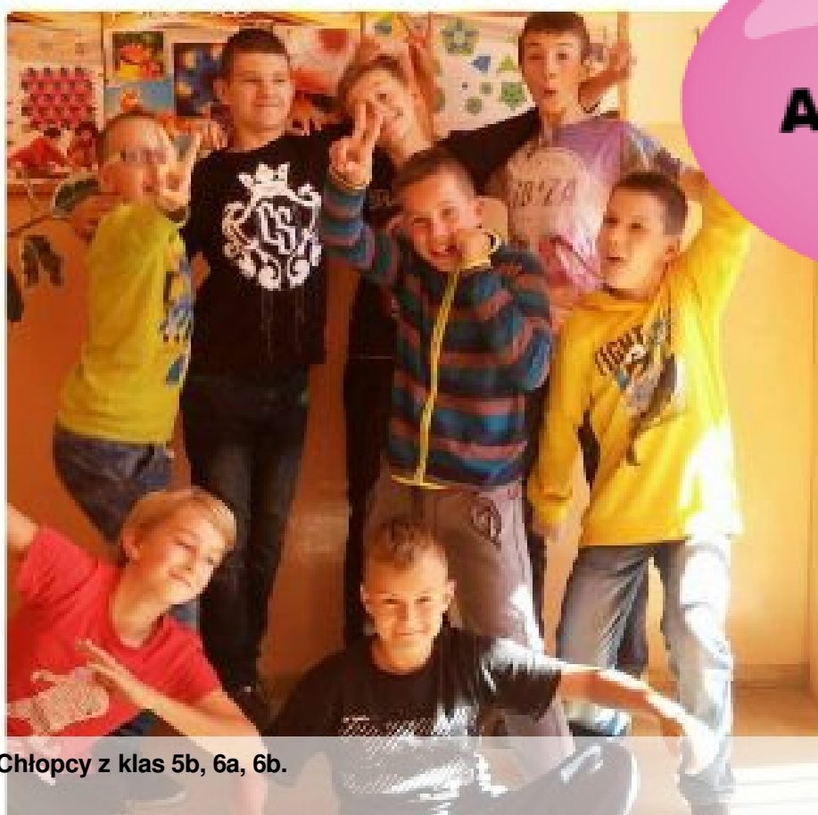
Chłopcy z klas 5b, 6a, 6b.