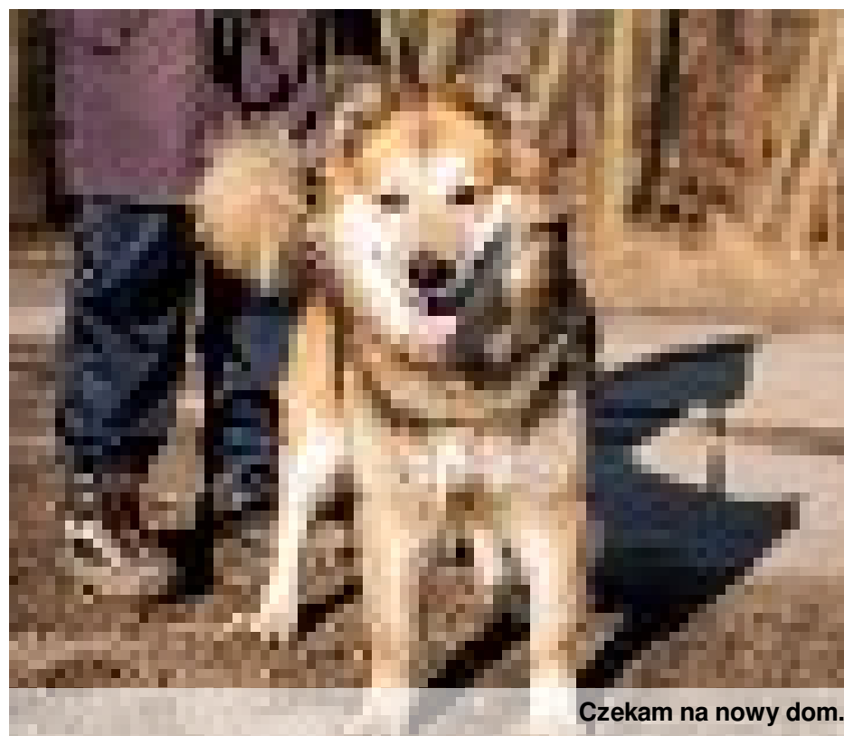
Czekam na nowy dom.