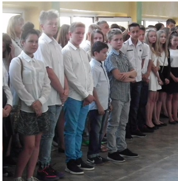
Uczniowie klas pierwszych

Dzwonek! Rok szkolny się zaczyna, Znów dni popłyną pracowite Nad książką szkolną, nad zeszytem. Życzę wam wszystkim na początek Szkolnego roku samych piątek / Jan Brzechwa/