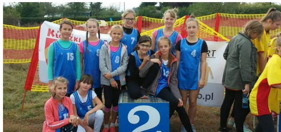
II miejsce biegi przełajowe