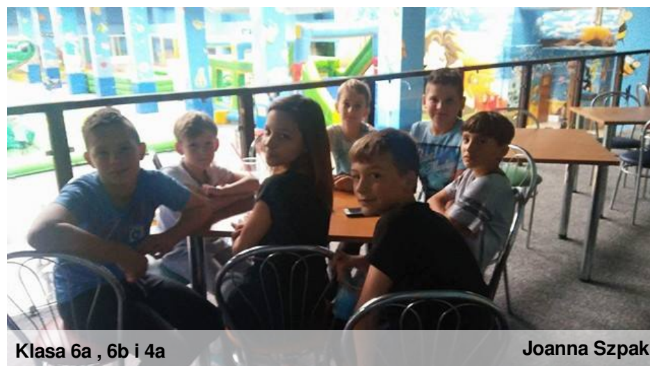
Klasa 6a , 6b i 4a