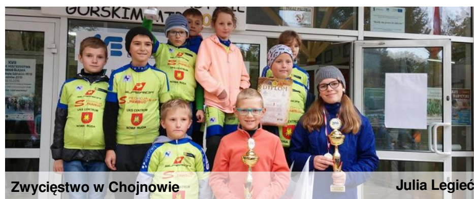
Zwycięstwo w Chojnowie