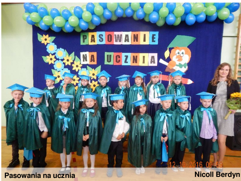
Pasowania na ucznia