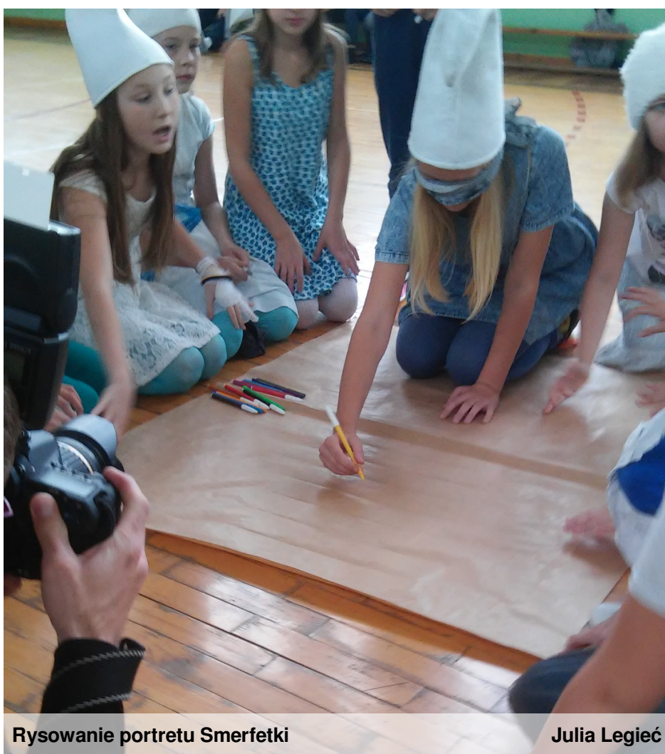
Rysowanie portretu Smerfetki