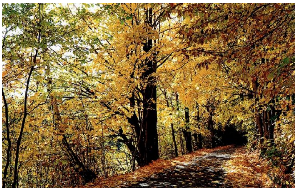
PS Jak nie kochać jesieni - II MIEJSCE