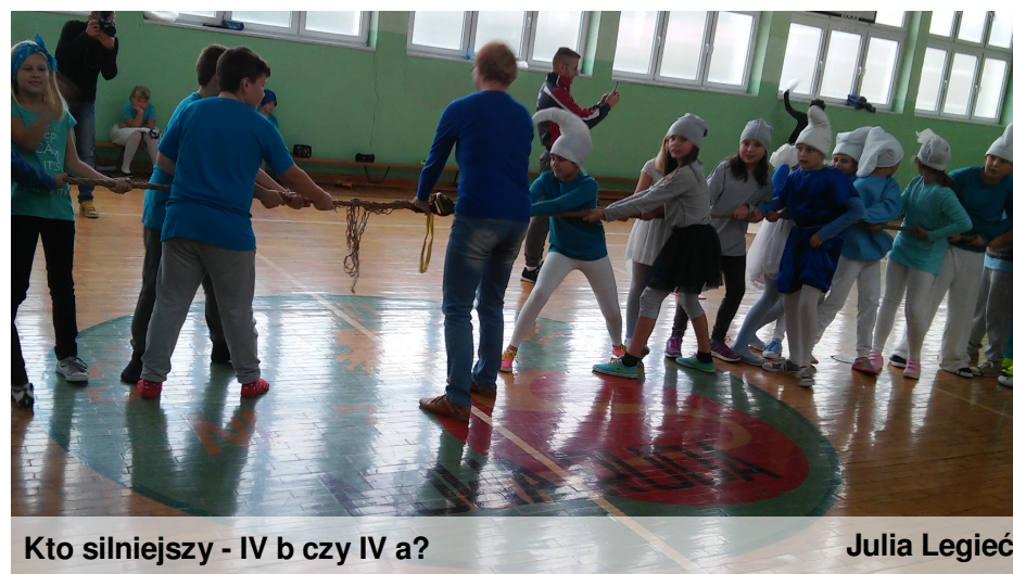
Kto silniejszy - IV b czy IV a?