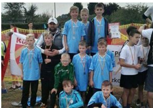
II miejsce biegi przełajowe