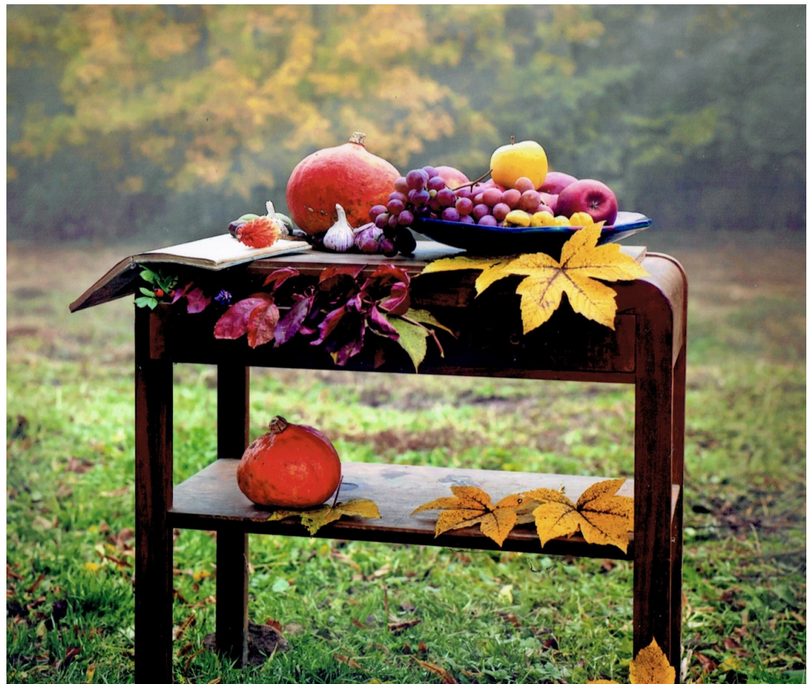
Skarby jesieni - I MIEJSCE