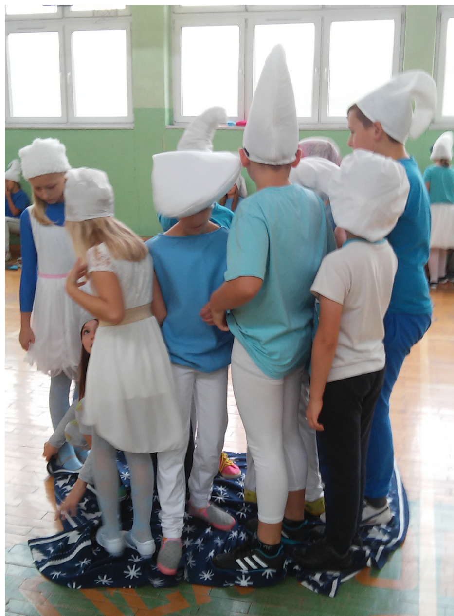
Ile Smerfów zmieści się na kocu?