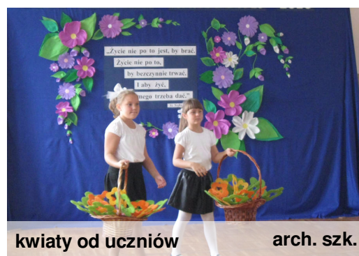
kwiaty od uczniów