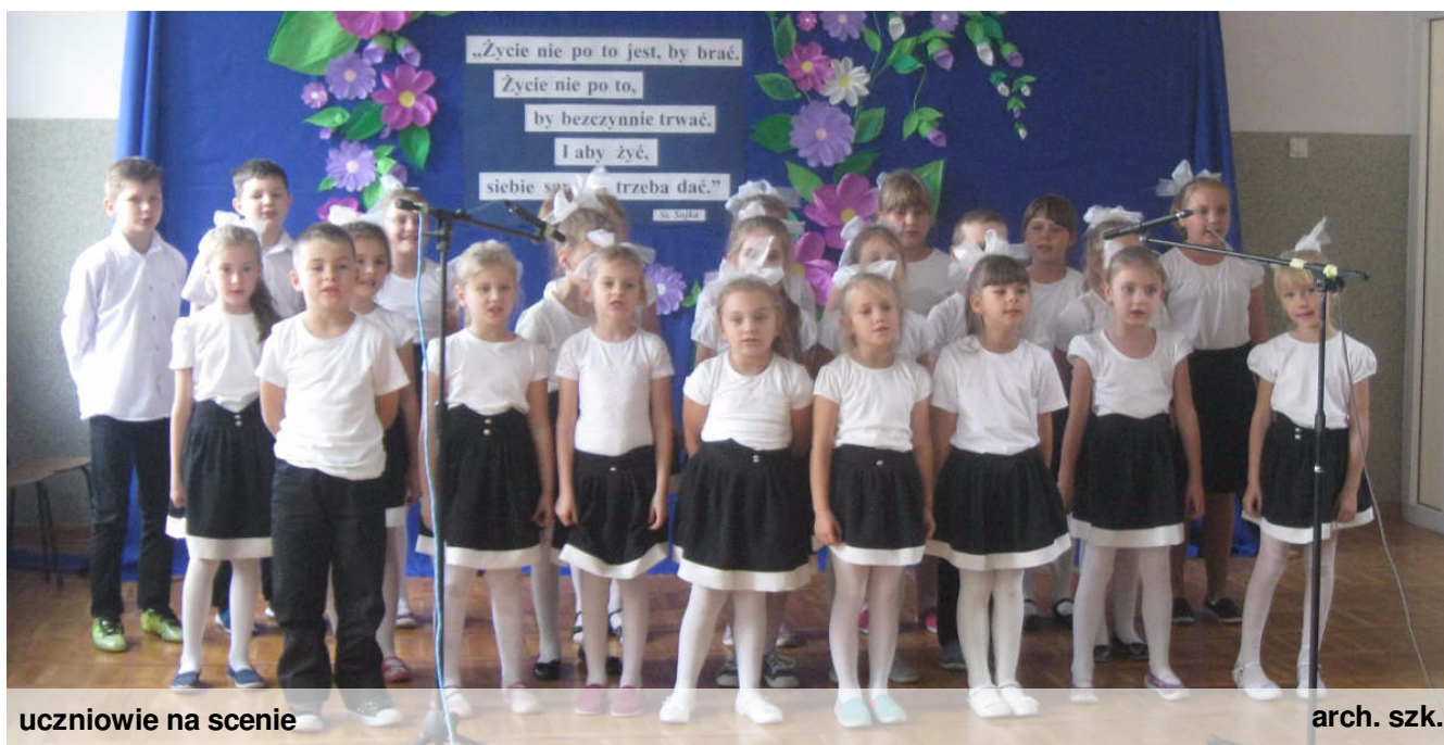
uczniowie na scenie