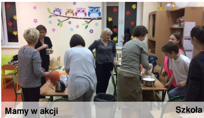
Mamy w akcji