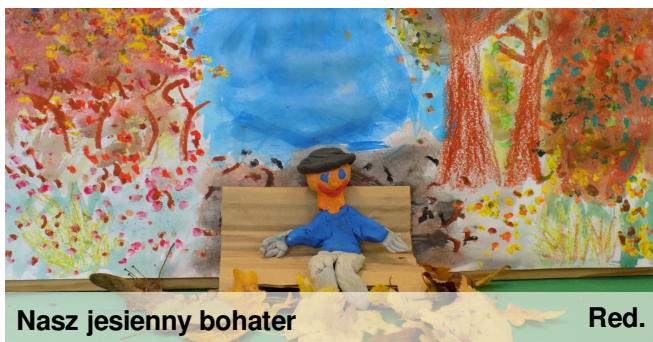
Nasz jesienny bohater

Wiadomość z ostatniej chwili: wygraliśmy!!!