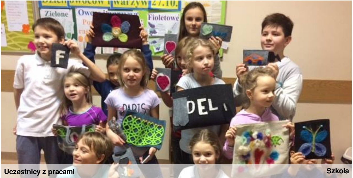
Uczestnicy z pracami