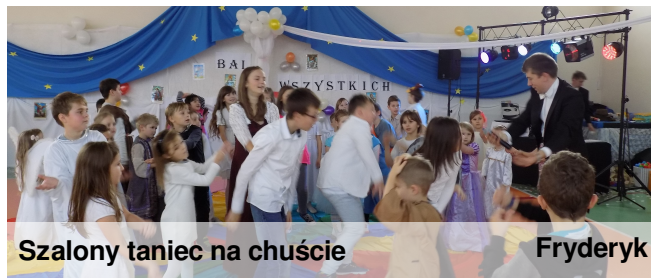
Szalony taniec na chuście

Wszystkie dzieci z ogromnym wybuchem radości i aplauzem przytaknęły. Każdy, kto przebrał się za świętego, dostał nagrodę w postaci książki.