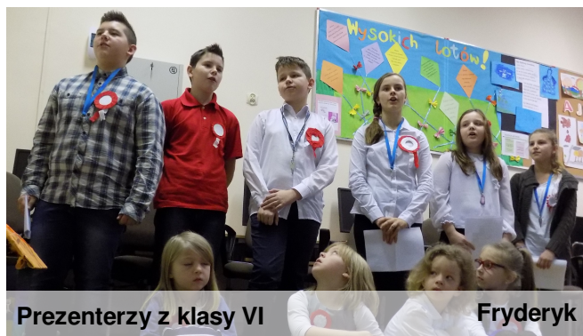
Prezenterzy z klasy VI