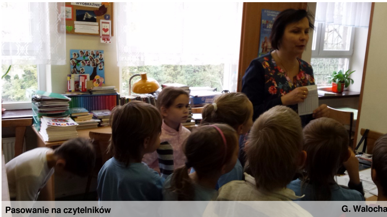
Pasowanie na czytelników