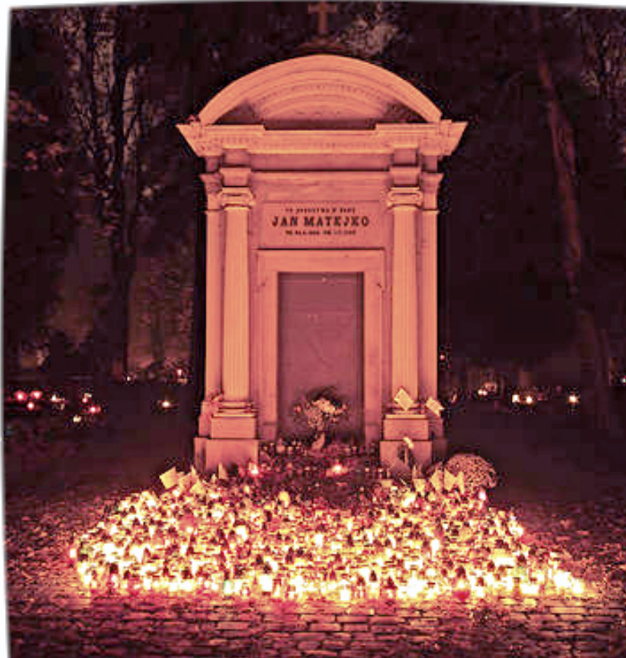
Cmentarz Rakowicki w Krakowie

i wcale mnie nie przeraża... myśleniu sprzyja tutejszy dostojny nastrój i klimat jakby jesienny – nie ważne czy wiosna, lato czy zima... przychodzę tu czasem, aby zadumać się choć przez chwilę nad losem żywych, do których mam nadal powrotny bilet... - M. Urban