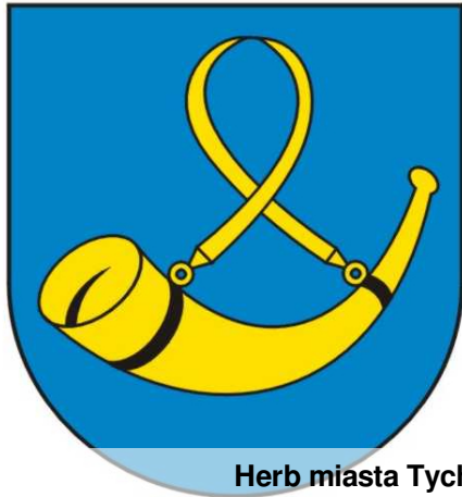
Herb miasta Tychy