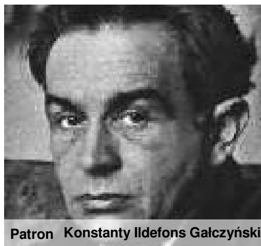
Patron Konstanty Ildefons Gałczyński