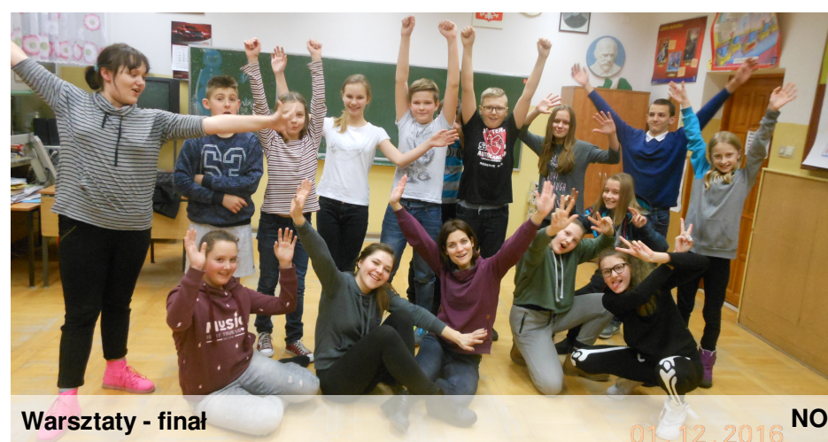
Warsztaty - finał