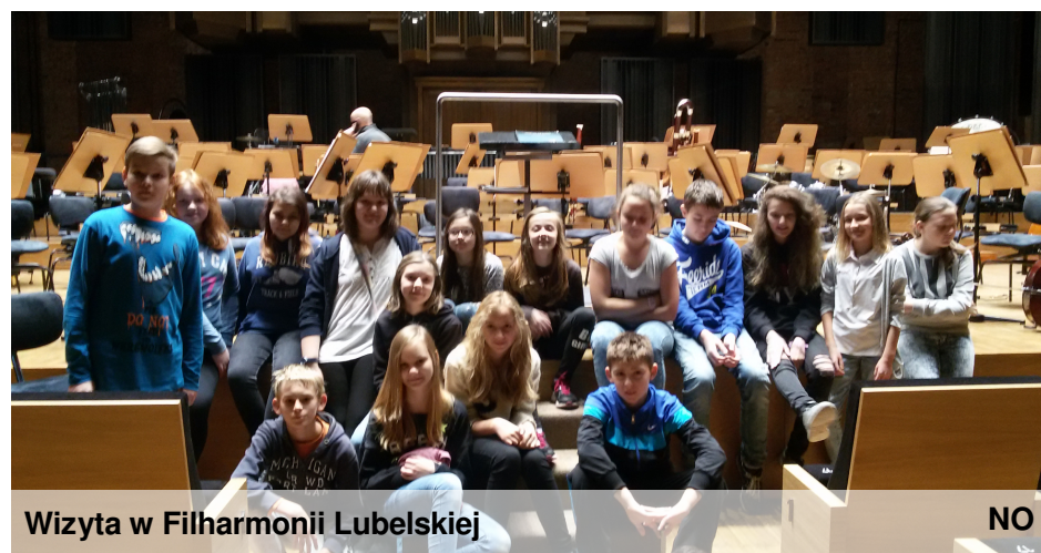
Wizyta w Filharmonii Lubelskiej

Wszyscy obecni na widowni patrzyli z podziwem. Każdy znał przynajmniej jeden grany utwór. Pod koniec próby muzycy z dyrygentem uklonili się i podziękowali za obecność. Myślę, że wszyscy byli zadowoleni z tej nietypowej lekcji muzyki.