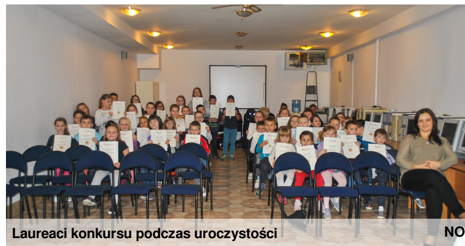
Laureaci konkursu podczas uroczystości