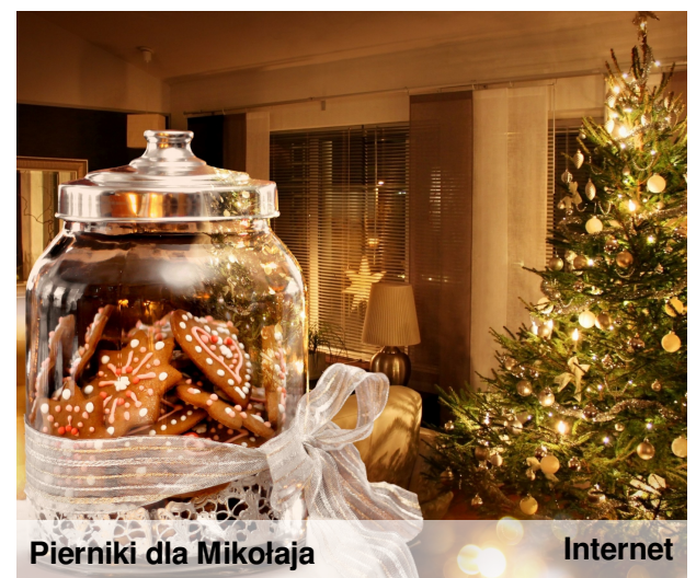
Pierniki dla Mikołaja