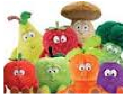
Oto cały gang świeżaków Rudi

Poznajcie szalony gang świeżaków! Świeżaki to są pluszaki z biedronki. Żeby dostać takiego świeżaka, trzeba zbierać 60 punktów. A jeśli chcesz mieć już wcześniej swojego wymarzonego misia, możesz go kupić za 20 zł, lecz musisz mieć już przynajmniej połowę punktów. W naszej szkole jest dokładnie 15 świeżaków. Niektóre dzieci mają nawet 2 misie. Na długich przerwach młodsze dzieci biorą pluszaki i się nimi bawią. To takie urocze !!!! Dokładnie w naszej szkole jest : 3 marchewki, pieczarki, 2 truskawki, 1 pomidor, 3 gruszki, 2 jabłka i 2 śliwki. Dzieci po prostu szaleją za pluszakami, ale szkoda, że akcja gangu się już powolutku kończy. (Rudi)