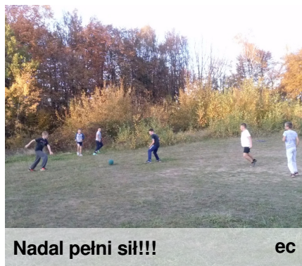
Nadal pełni sił!!!