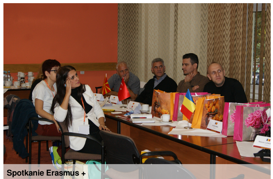
Spotkanie Erasmus +