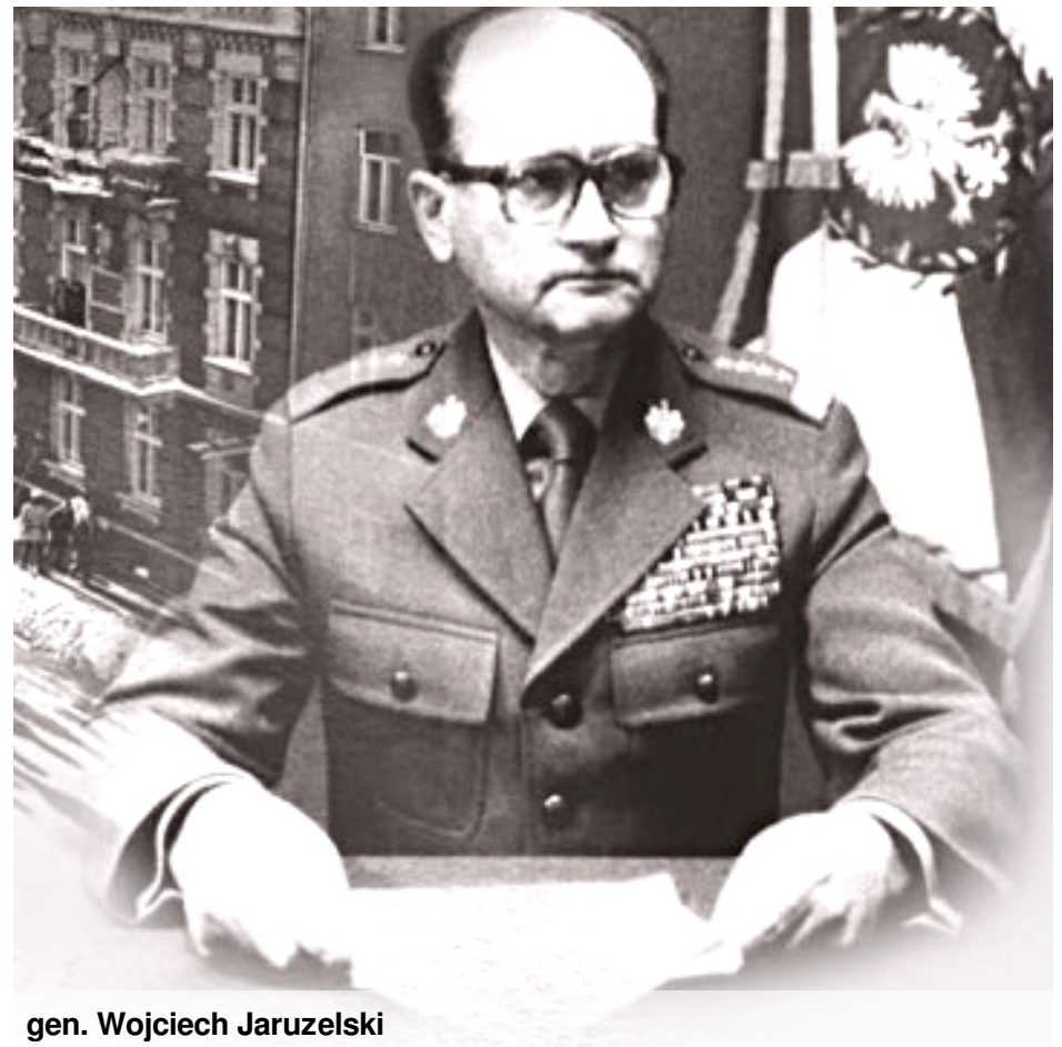
gen. Wojciech Jaruzelski