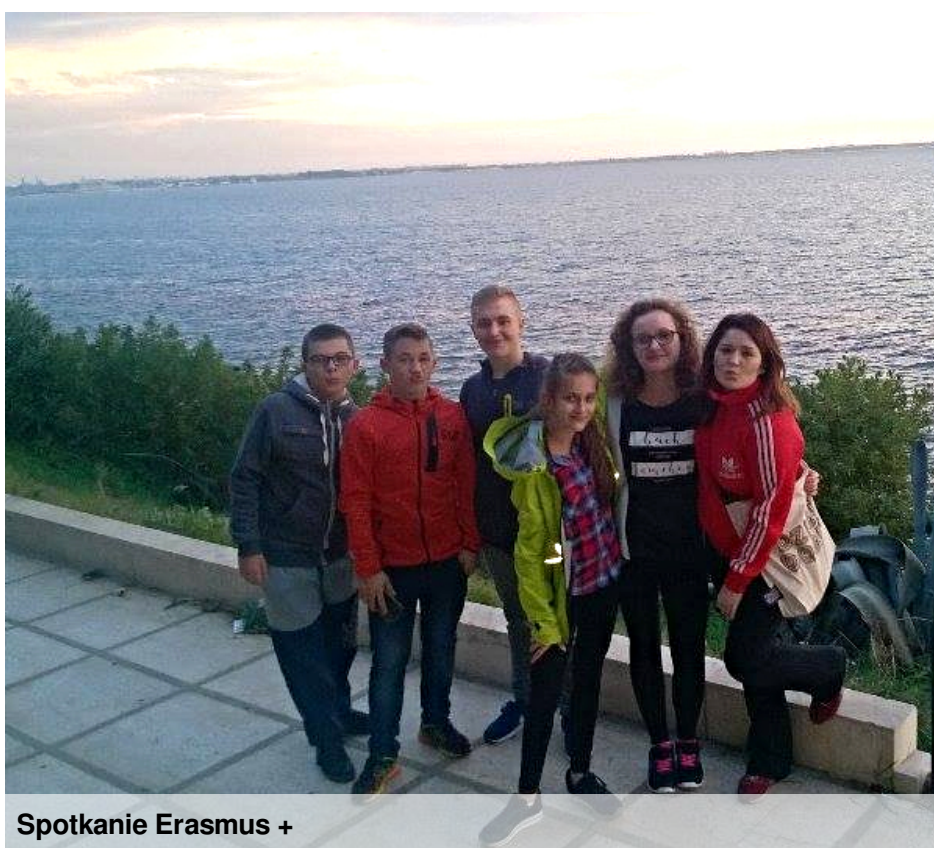
Spotkanie Erasmus +