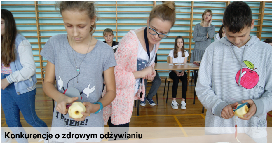
Konkurencje o zdrowym odżywianiu