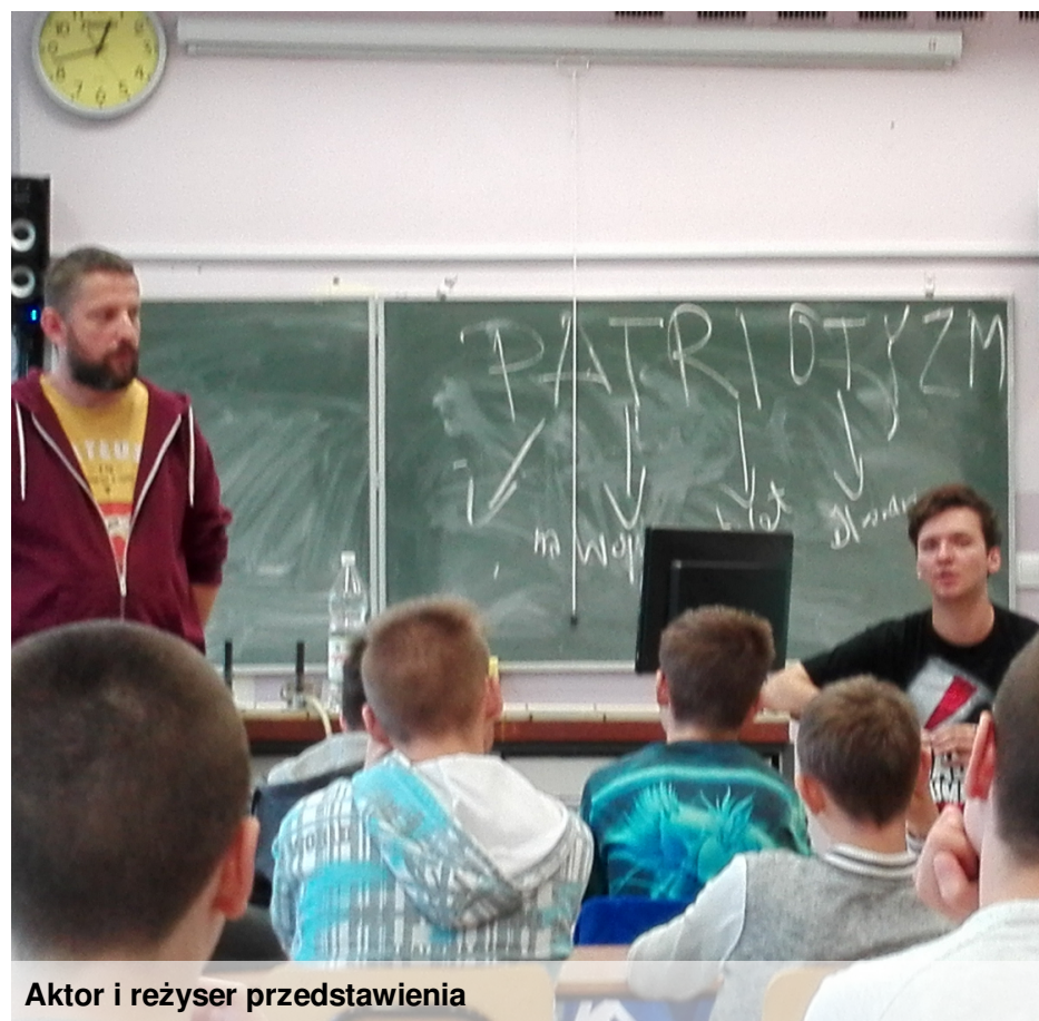
Aktor i reżyser przedstawienia

czerwoną” to lekcja języka polskiego, historii i woju w ciągu dwóch godzin lekcyjnych. Mądra, poddająca refleksji podstawowe zagadnienia, o których rozmawia się coraz rzadziej. Jej dużym atutem jest to, że wchodzi w środowisko szkolne, a główny bohater to taki sam uczeń jak nasi gimnazjaliści i to od nich zależy, czy pójdą tą samą drogą, czy przemyślą swoje postawy.