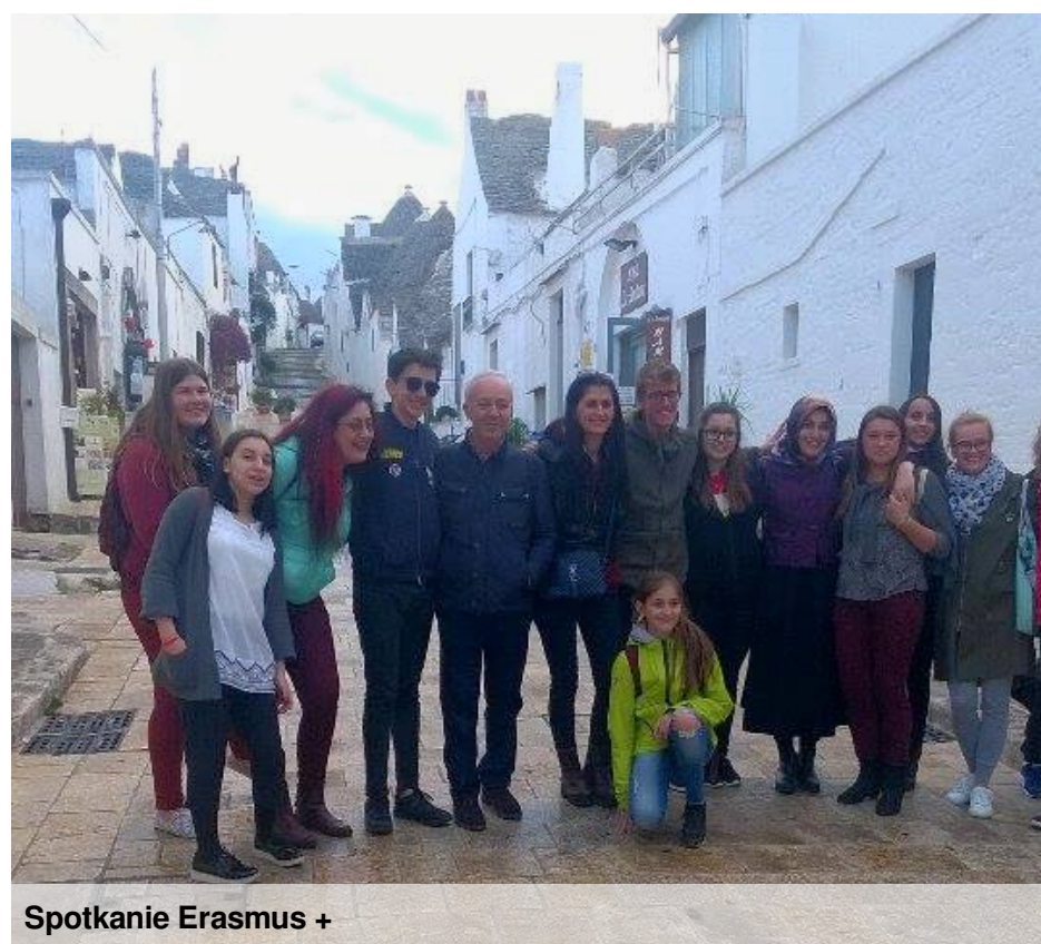
Spotkanie Erasmus +