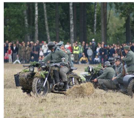
Na zdj. Sceny z inscenizacji bitwy pod Krojantami.

z Urzędem Gminy Chojnice. 5.09.2010 roku po raz dziesiąty odbyła się rekonstrukcja bitwy pod Krojantami. Widowisko historycznomilitarne skupiło największą jak dotąd liczbę osób, blisko 20 tys.