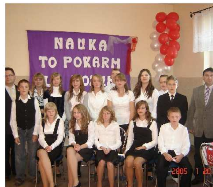
Na zdj. uczniowie kl. I g. podczas uroczystości pasowania na gimnazjalistę.

pierwsza, niczym koty wciągała mleko przez słómkę. Drudzy w kolejce, jak sądzą pozostali, mieli najtrudniejsze wyzwanie, musztarda, keczup oraz chrzan- jedzone za pomocą słodkiego smoczka- lizaka, nie przypadły nam do gustu (na zdj.). Pozostali