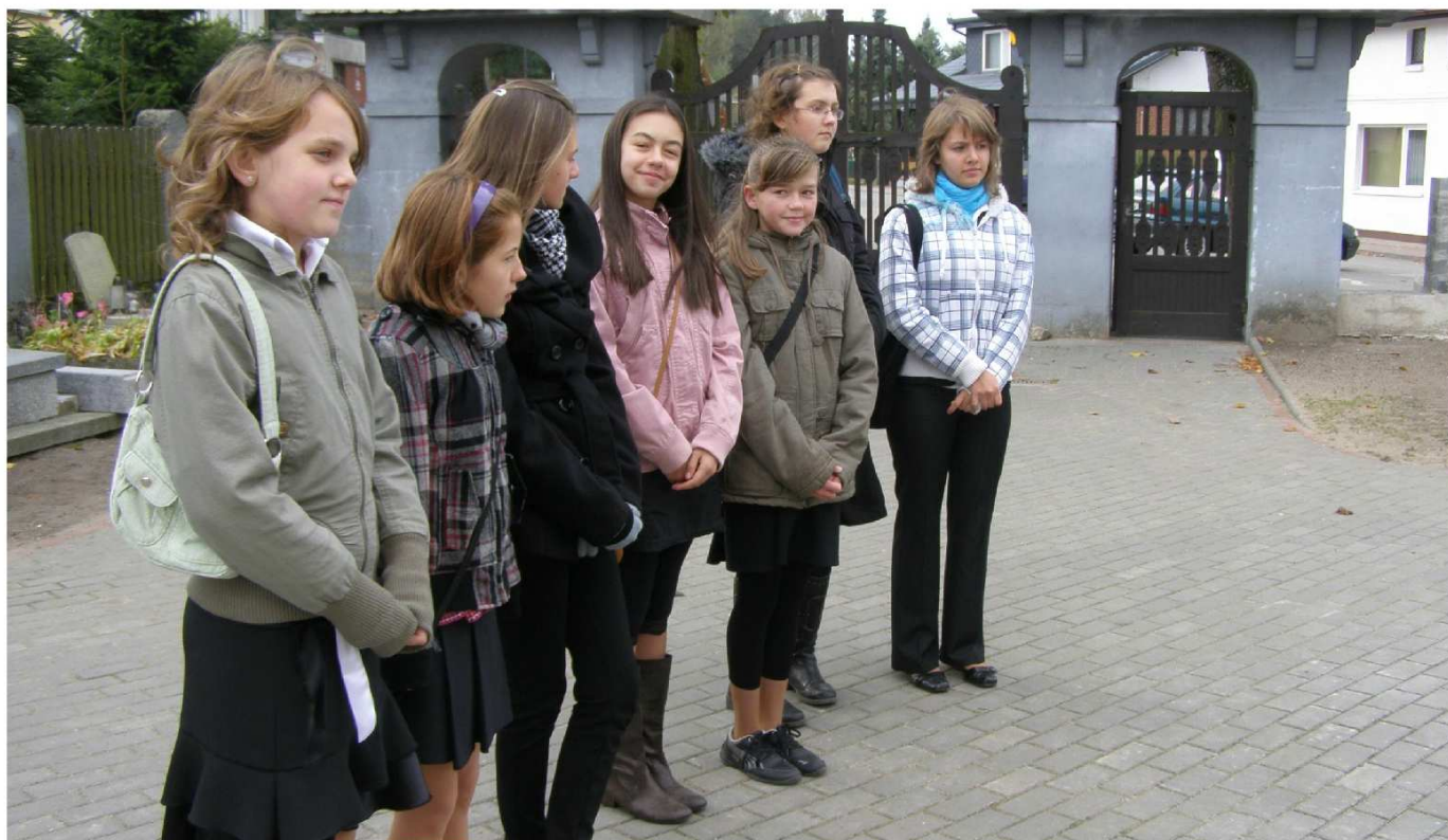
Zdj. Przedstawiciele samorządów uczniowskich podczas wizyty na cmentarzu 29.10.2010

Coroczną tradycją Zespołu Szkół w Swornegaciach jest odwiedzanie miejscowego cmentarza, by zapalić znicze zmarłym nauczycielom i pracownikom szkoły. Uczniowie zapalają też światełka przy krzyżu cmentarnym i tablicy upamiętniającej ofiary II wojny światowej ze Swornegaci.