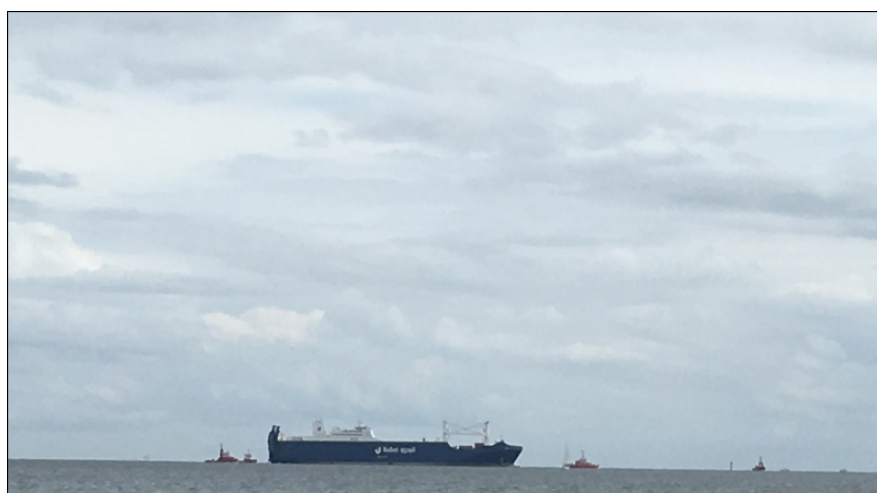
Statki oczekujące na wplynięcie do portu.