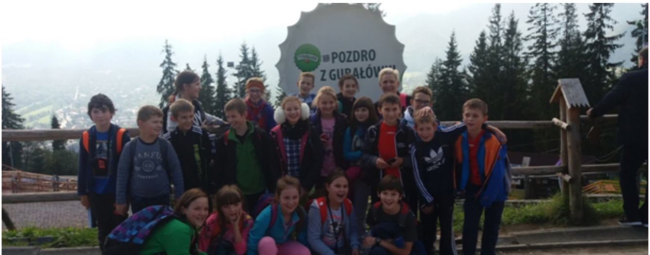
Gubałówka - 5b.

Powrót do szkoły to nie tylko lekcje- nauka, kartkówki, sprawdziany, ale także ciekawe zajęcia poza nią. Przykładem są wycieczki podczas, których możemy się wiele nauczyć. Z tym, że w tym przypadku wiedzę zdobywamy w trochę inny sposób. Przyjemniejszy? Pewnie wielu z Was odpowie, że tak. Klasom V udało się już we wrześniu wybrać na wycieczki: 5a w Pieniny a 5b do Zakopanego.