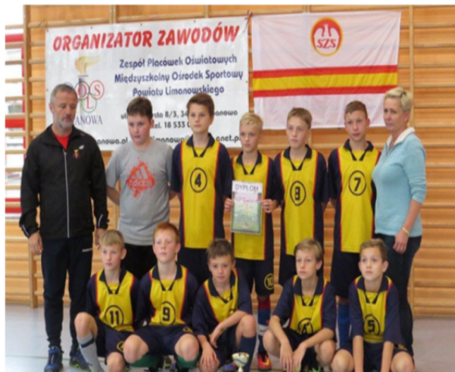
Pow. Igrzyska Młodzieży Szkolnej