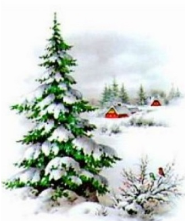
Święta tuż, tuż...

Wszyscy uczniowie otrzymali dyplomy i upominki.