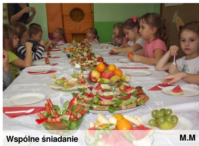
Wspólne śniadanie M.M