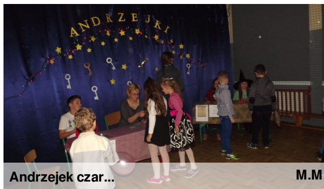
Andrzejek czar... M.M