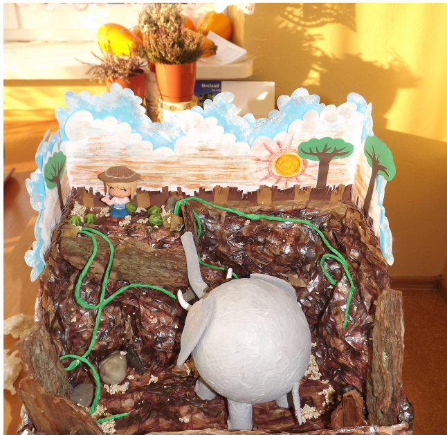
Makieta do "W pustyni i w puszczy"