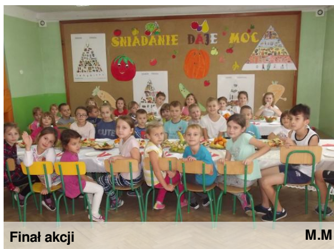
Finał akcji M.M