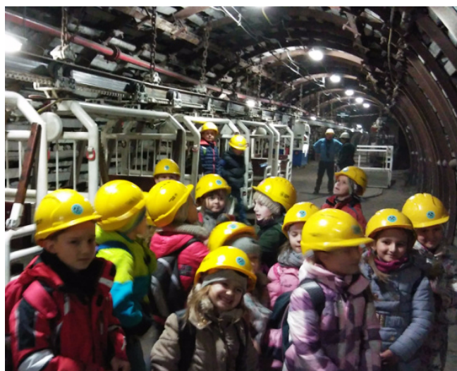
W podziemiach kopalni