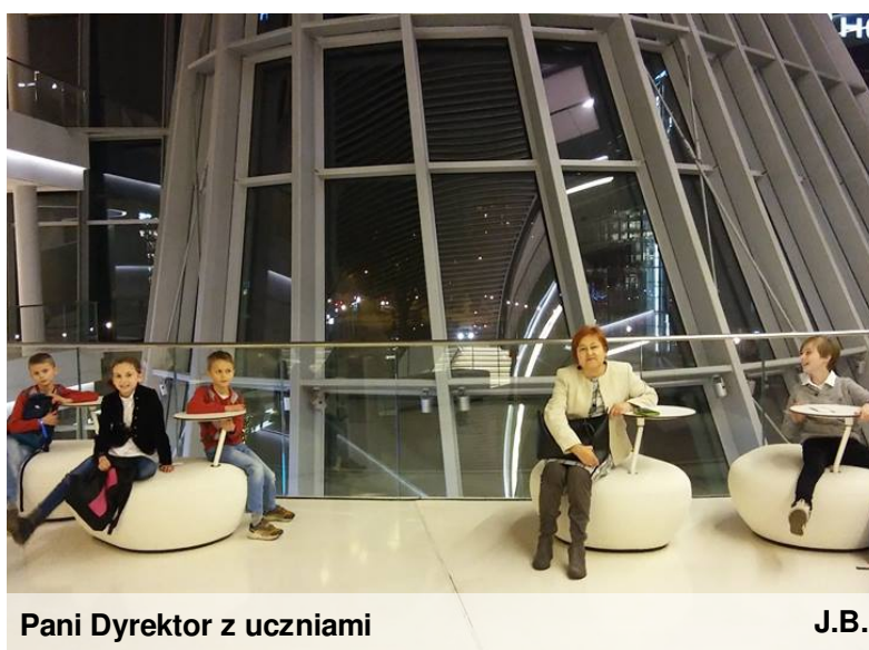
Pani Dyrektor z uczniami