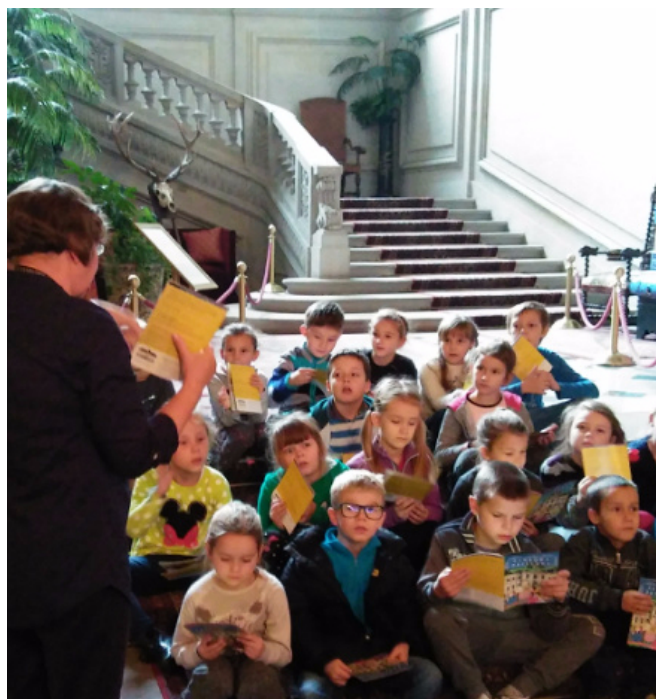
W Zamku w Pszczynie