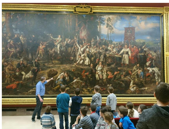
Przed obrazem Jana Matejki