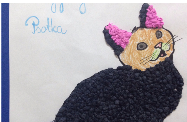
Przygody kotka Psotka