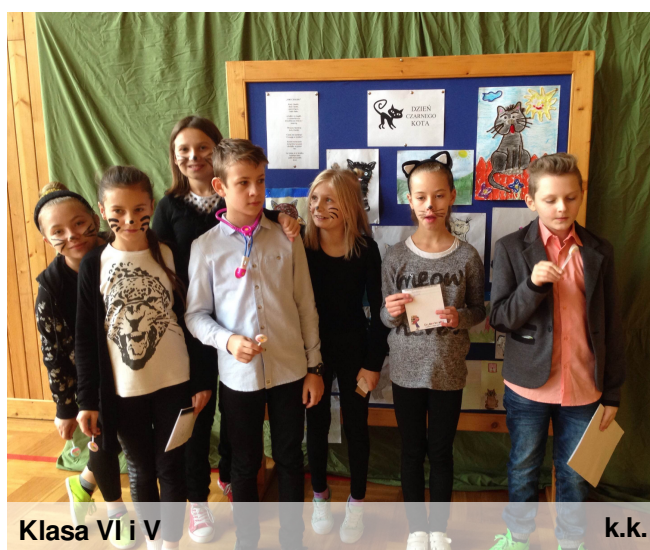
Klasa VI i V