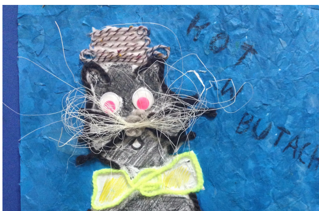
Kot w butach