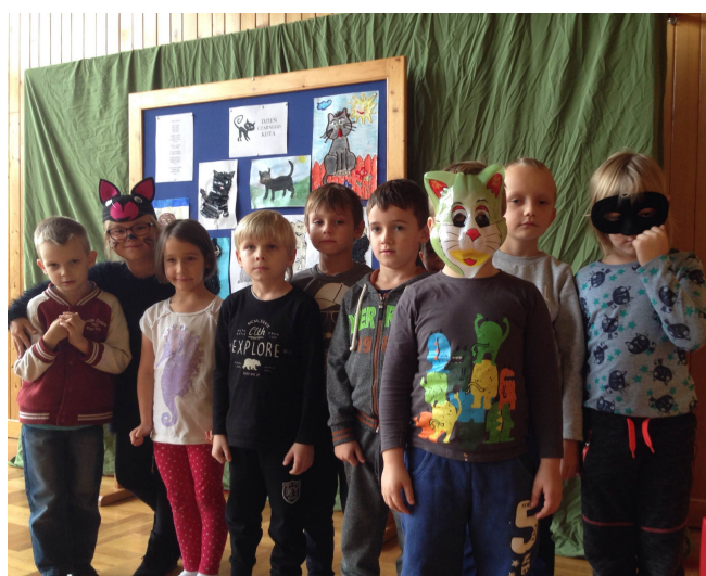
Najmłodszy uczestnicy zabawy