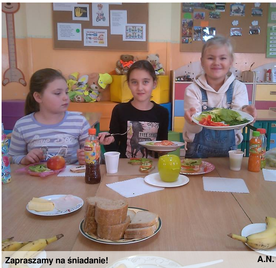
Zapraszamy na śniadanie!