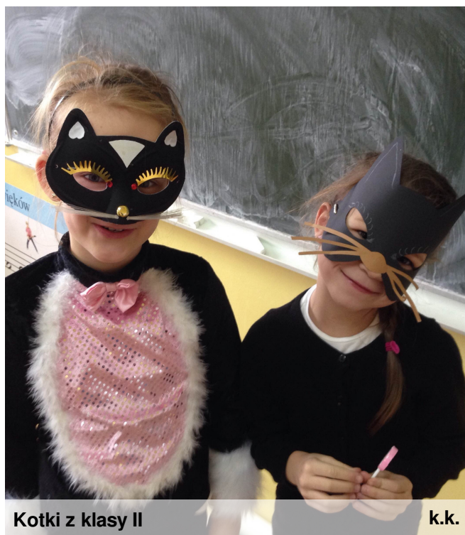
Kotki z klasy II

Czy wiecie, że koty mają swoje święto? Otóż, 17 listopada obchodzony jest Dzień Czarnego Kota. Postanowiliśmy, że to nietypowe święto zagości w tym roku w kalendarzu imprez szkolnych. W tym dniu chętni uczniowie przyszli ubrani na czarno z doklejonymi lub dorysowanymi kocimi atrybutami - jedni mieli długie ogonki, inni zamaszyste wąsy, jeszcze inni słodkie kocie uszka. Nasi najmłodszy szkolni artyści z przedszkola przygotowali fantastyczne prace plastyczne, na których znaleźli się koci bohaterowie. Trzeba przyznać, że przedszkolaki wykazały się wyjątkową inwencją twórczą - ich koty zrobione były z włóczek, kaszy, waty, papieru kolorowego i prezentowały się okazale. Starsi uczniowie przygotowali recytację wierszy o kotach, niektórzy zdecydowali się, by zamruczeć lub zamruczeć na scenie. A wszystkie te przedsięwzięcia miały zwrócić uwagę uczniów na potrzebę czytania i korzystania ze zbiorów bibliotecznych. Występy artystów zostały nagrodzone słodyczami i punktami wpisanymi na kartę aktywności czytelnicy w ramach Szkolnego Programu Promocji Czytelnictwa.