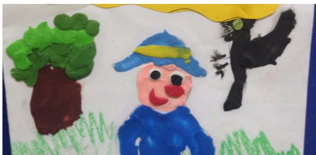
Czarnoksiężnik z Krainy Oz

W ramach Szkolnego Programu Promocji Czytelnictwa chętni uczniowie wzięli udział w konkursie na projekt okładki swojej ulubionej książki. Do biblioteki szkolnej spłynęło wiele prac, spośród których wyłoniono trzy najlepsze projekty. Wybrane prace możecie podziwiać w tym wydaniu "Adasia", zaś wszystkie dzieła w naszej bibliotece. Wszystkim gratulujemy i jak zwykle zachęcamy do