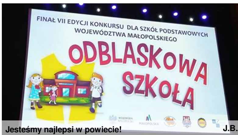
Jesteśmy najlepsi w powiecie!