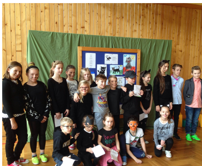
Dzień Czarnego Kota