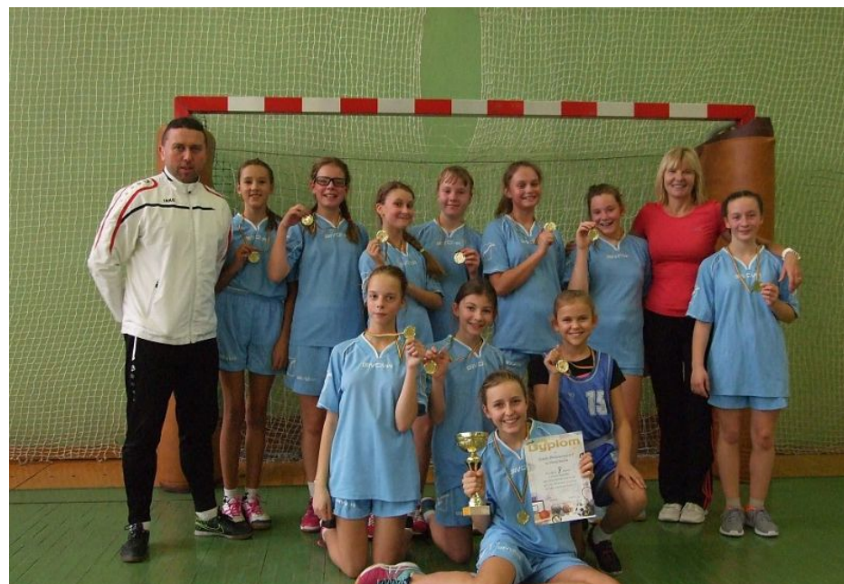
Dziewczęta SP 7 koszykówka