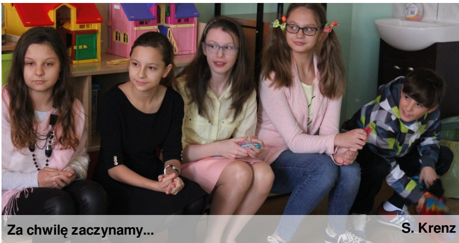
Za chwilę zaczynamy...