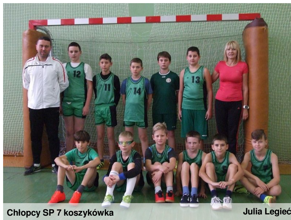
Chłopcy SP 7 koszykówka