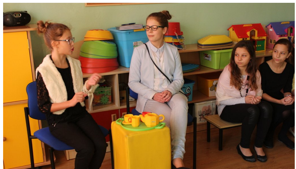
Ploteczki o zachowaniu młodzieży