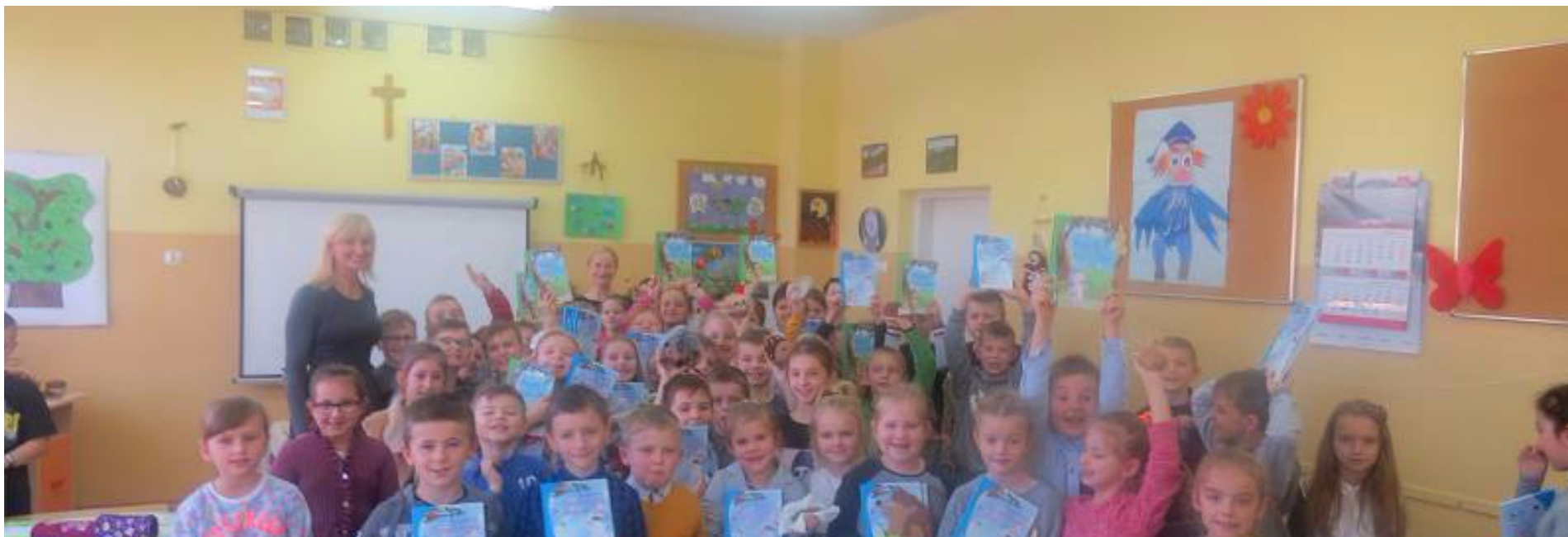
Spotkanie z autorką książek dla dzieci