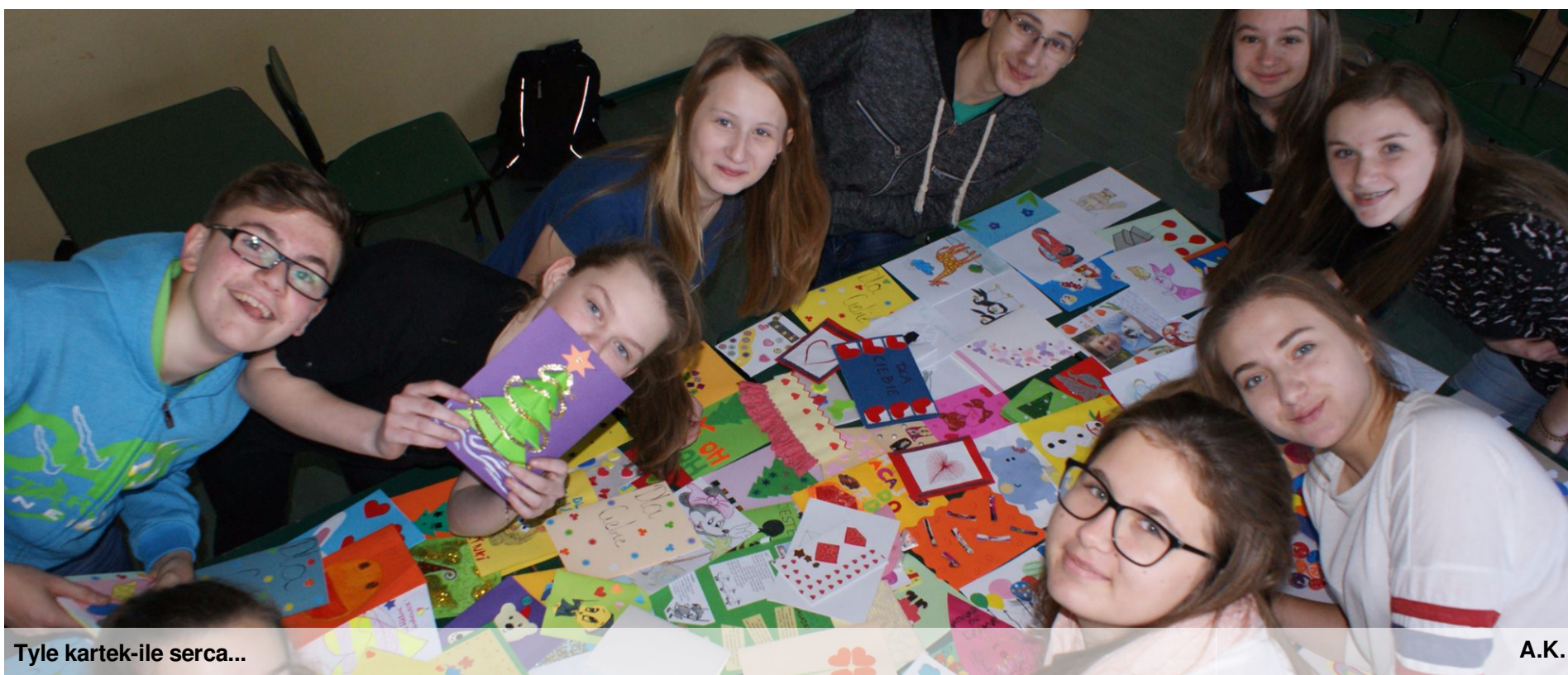
Tyle kartek-ile serca...