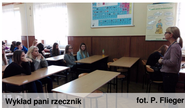
Wykład pani rzecznik