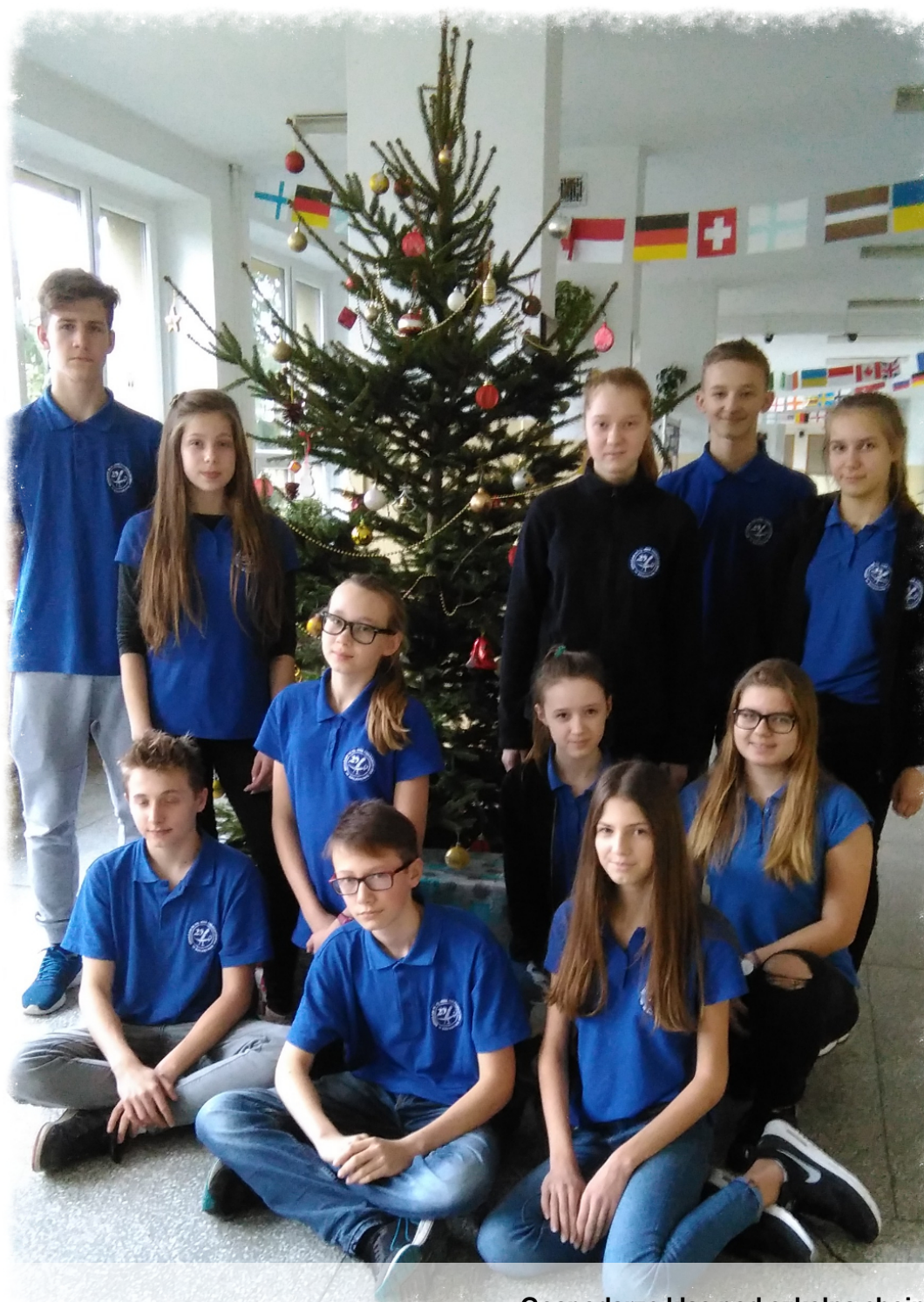
Gospodarze klas pod szkolną choinką

Gdy zabrzmia kolędy pierwsze tony, odłóżmy na bok smartfony. Nie kłóćmy się na facebooku, że ktoś nie ma racji, z bliskimi w spokoju spotkajmy się przy wigilijnej kolacji. Gdy pierwsza gwiazdka zaśnie na niebie, cieszymy się, że mamy siebie! Niech te magiczne chwile jak najdłużej trwają, prezenty pod choinką cierpliwie poczekają. Po świątecznym posiłku przyda się trochę ruchu, więc zanurkujmy w białym puchu. Jak dzieci bawmy się w te święta, niech każdy z nas na długo je zapamięta.