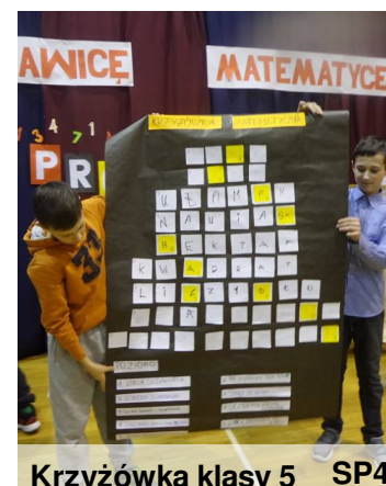
Krzyżówka klasy 5 SP4