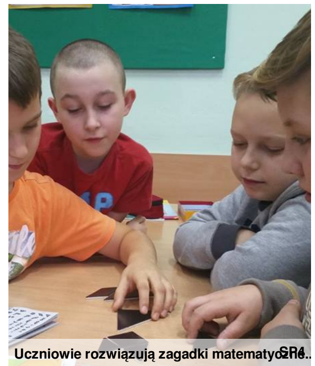
Uczniowie rozwiązują zagadki matematyczne.