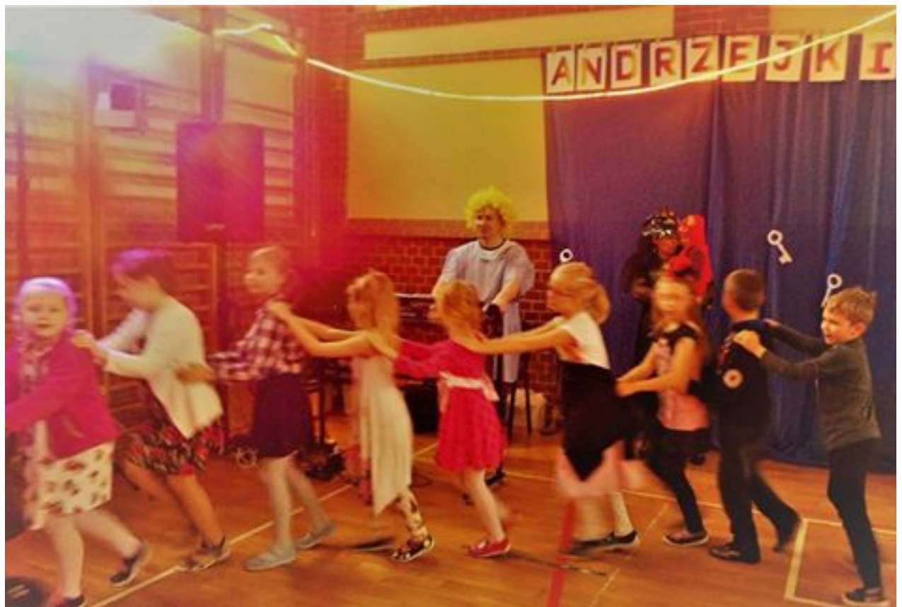
Tak się bawiły klasy młodsze...