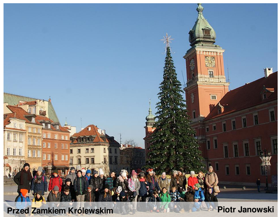
Przed Zamkiem Królewskim

Mimo, że wyjechaliśmy bardzo wcześnie, o godzinie 5:15, wszyscy byli weseli i podekscytowani. Dla niektórych naszych kolegów i koleżanek była to pierwsza wizyta w stolicy. Naszym środkiem transportu był wygodny i duży autokar. Do Warszawy przyjechaliśmy około godziny 11. Gdy wysiedliśmy z autokaru od razu poszliśmy pod Kolumnę Zygmunta, która jest jednym z najbardziej rozpoznawalnych symboli Warszawy. Następnie z nadzieją, że zobaczymy Prezydenta RP, udaliśmy pod Pałac Prezydencki. Niestety nie udało się. Potem zobaczyliśmy jeszcze Grób Nieznanego Żołnierza, zmianę warty oraz pomnik Syrenki na Starym Mieście. Najważniejszym punktem programu było Centrum Nauki Kopernik. Spędziliśmy tam kilka godzin świetnie bawiąc się, a przy tym ucząc. Na koniec naszego pobytu poszliśmy na pizzę. Do Gdańska wróciliśmy po północy. Uważam, że wycieczka była bardzo udana i chcielibyśmy takich więcej!