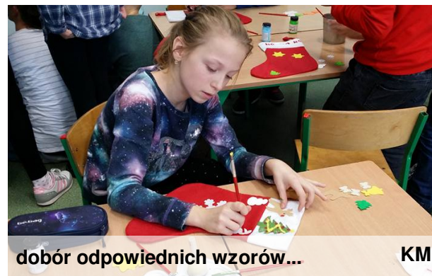
dobór odpowiednich wzorów... KM