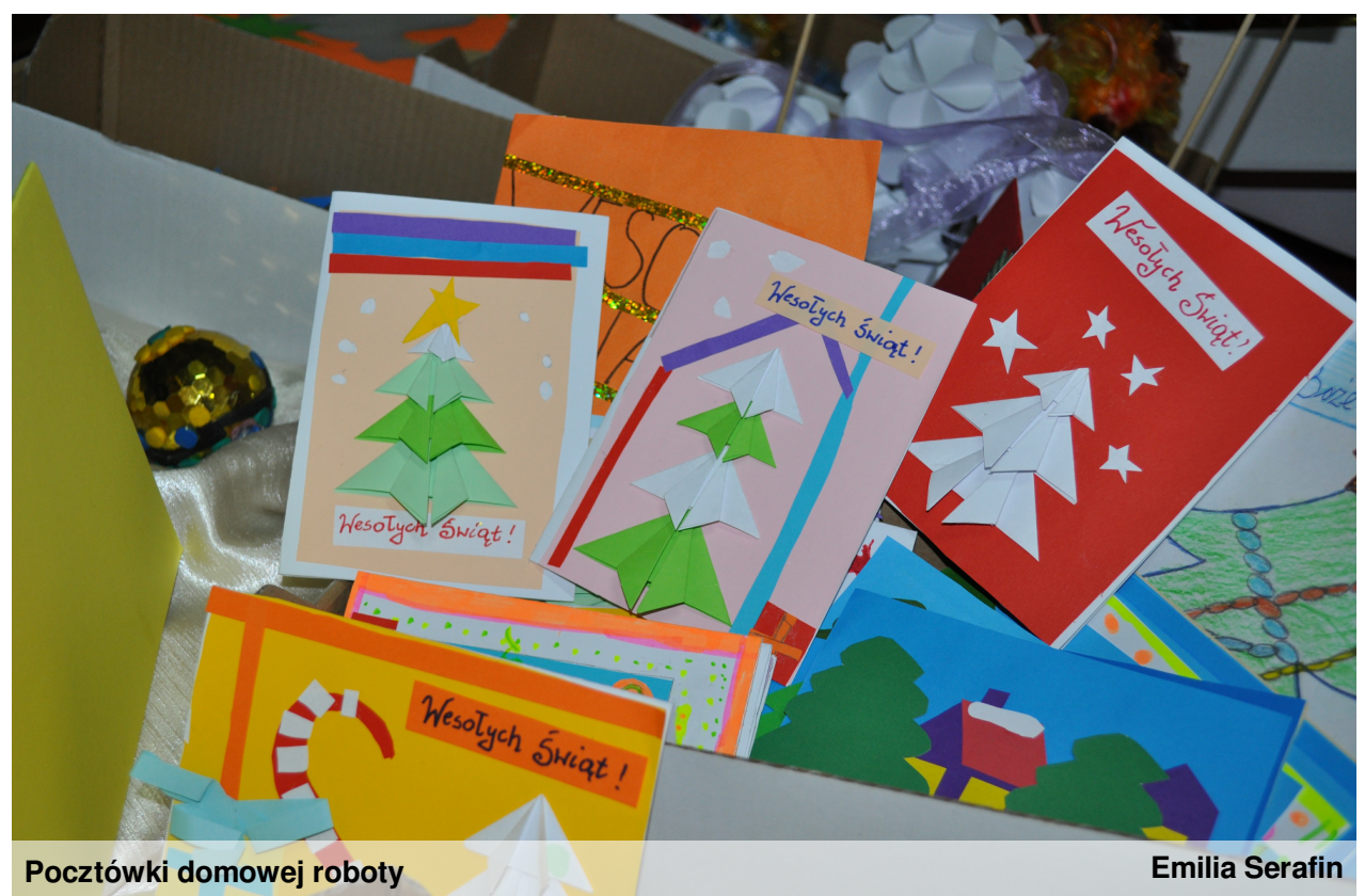
Pocztówki domowej roboty