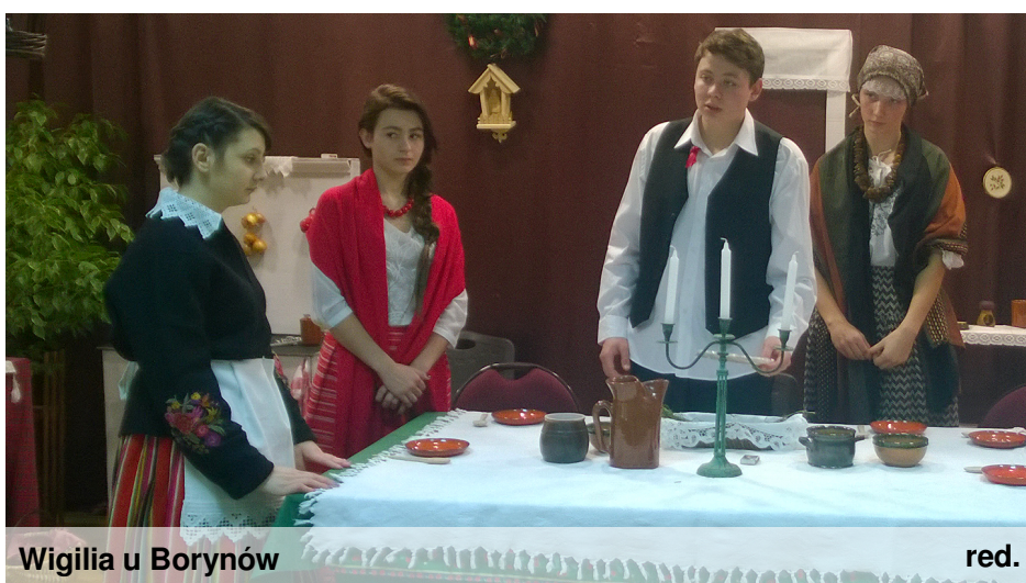
Wigilia u Borynów