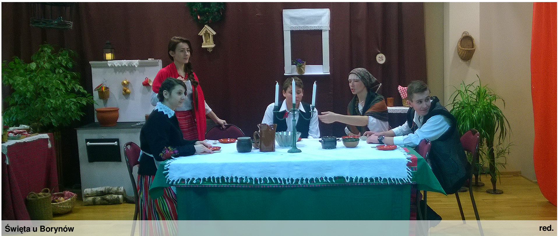
Święta u Borynów