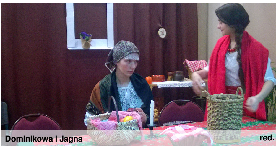
Dominikowa i Jagna