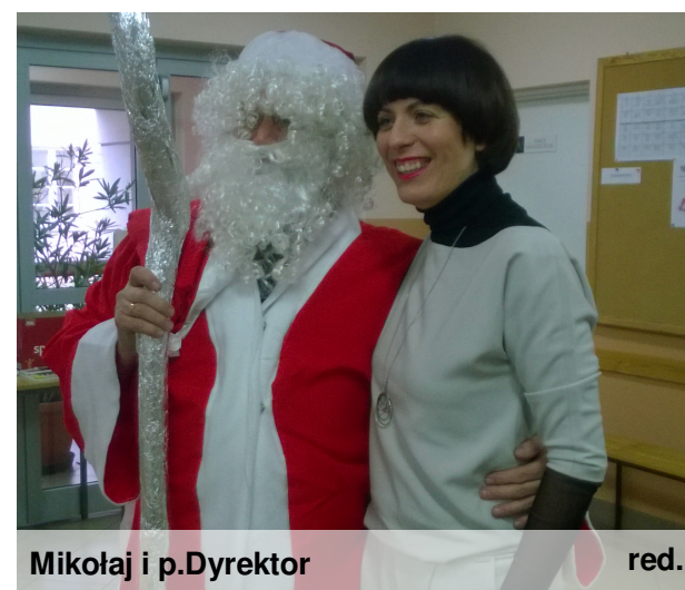
Mikołaj i p.Dyrektor

Tuż przed Świątami, gdy w szkole odbywały się Klasowe Wigilie, pojawił się niespodziewanie św. Mikołaj. Zajrzał do nas zwabiony zapachem wyjątkowo smacznych potraw. Odwiedził każdą klasę. Był w doskonałym humorze - rozdawał prezenty, żartował, chętnie pozował do zdjęć. Mikołajowi bardzo spodobały się pozytywne wibracje wyczuwalne tego dnia w szkole.