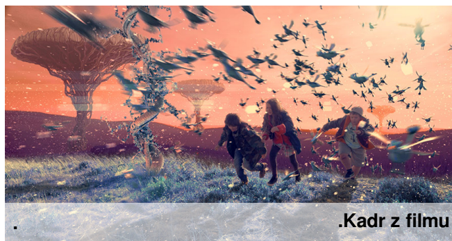
.Kadr z filmu

Jak na film dla dzieci akcja „Za niebieskimi drzwiami” zaczyna się bardzo mocno. Od wypadku samochodowego, po którym matka głównego bohatera zapada w śpiączkę. A potem jest już ja w baśni: miłość matki i syna, zła czarownica – bezdzietna ciotka, wstrętna jędza; dziecięca solidarność w walce ze złem, prawo do inności. Są też samotność dziecka, tęsknota za nieobecnym ojcem, rozpacz, a przede wszystkim fantazja. Dziecko, które nie daje sobie rady z życiem, szuka ratunku w wyobraźni. Za niebieskimi drzwiami... Ola