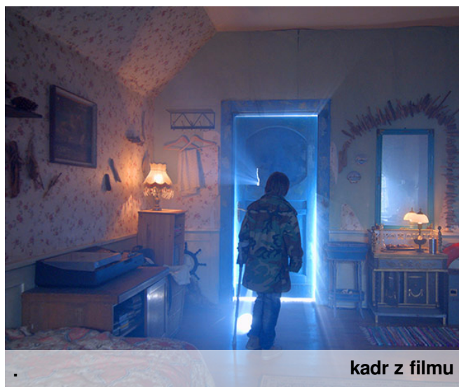
kadr z filmu

Jak na film dla dzieci akcja „Za niebieskimi drzwiami” zaczyna się bardzo mocno. Od wypadku samochodowego, po którym matka głównego bohatera zapada w śpiączkę. A potem jest już ja w baśni: miłość matki i syna, zła czarownica – bezdzietna ciotka, wstrętna jędza; dziecięca solidarność w walce ze złem, prawo do inności. Są też samotność dziecka, tęsknota za nieobecnym ojcem, rozpacz, a przede wszystkim fantazja. Dziecko, które nie daje sobie rady z życiem, szuka ratunku w wyobraźni. Za niebieskimi drzwiami... Ola