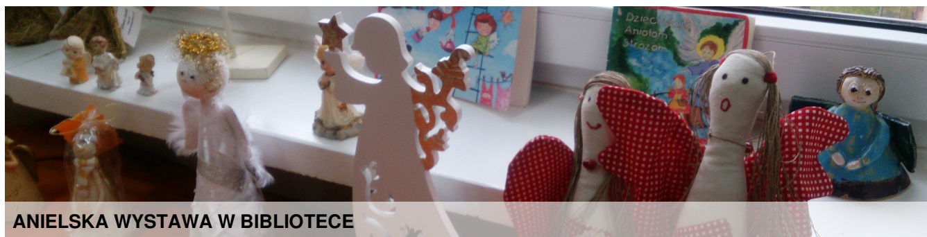
ANIELSKA WYSTAWA W BIBLIOTECE