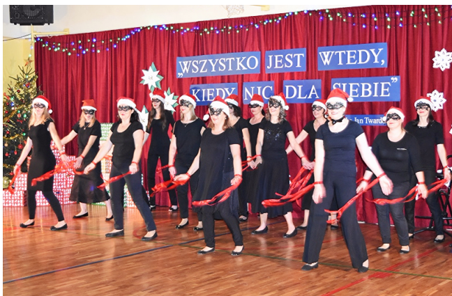
Grupa Taneczna :)