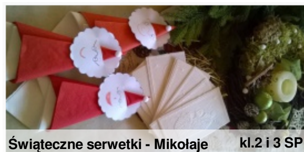
Świąteczne serwetki - Mikołaje