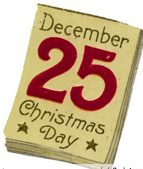
oto christmas crackers