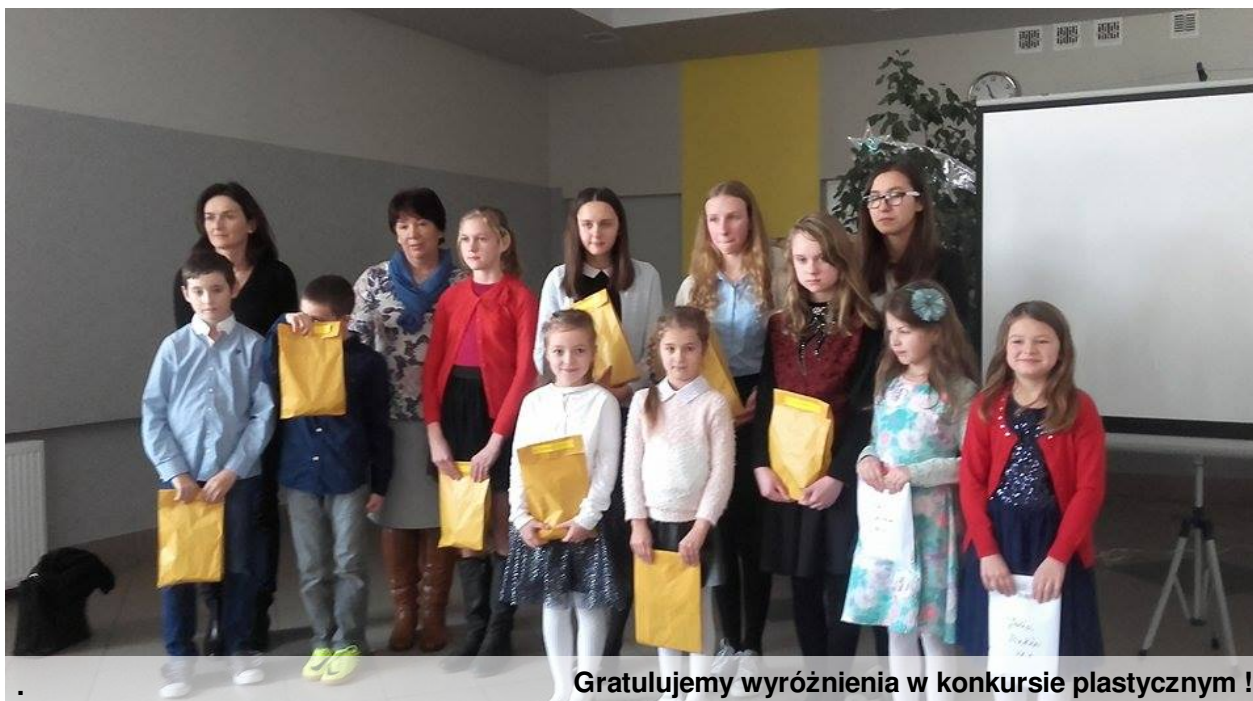
Gratulujemy wyróżnienia w konkursie plastycznym !

Świąteczne pozdrowienia dla Was nasi drodzy czytelnicy od całej naszej redakcji:) Bądźcie z nami. Wkrótce kolejny numer naszej gazetki:)