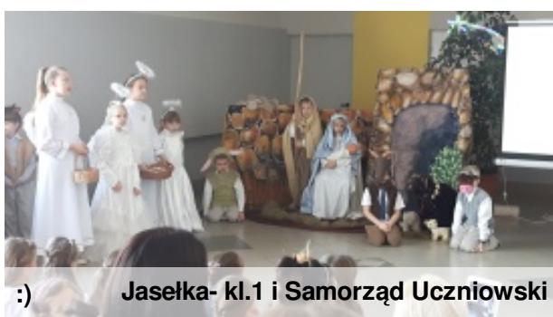
:) Jasełka- kl.1 i Samorząd Uczniowski