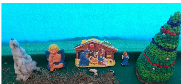
kl 1-3 SP

Ciekawe ozdóbki na choinkę można wykonać w prosty sposób: np. ozdoby z masy solnej, papieru kolorowego, origami. Można pomalować lub poobklejać bombki styropianowe, pomalować gipsowe ozdoby, zrobić choinkę z bibuły, powycinać aniołki z papieru i już:) Życzymy udanych ozdób choinkowych:)