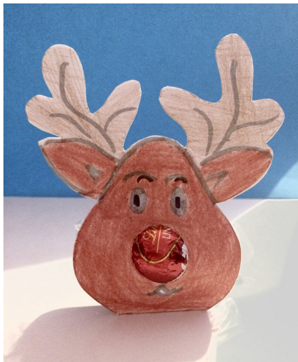
kl.2 i 3 SP