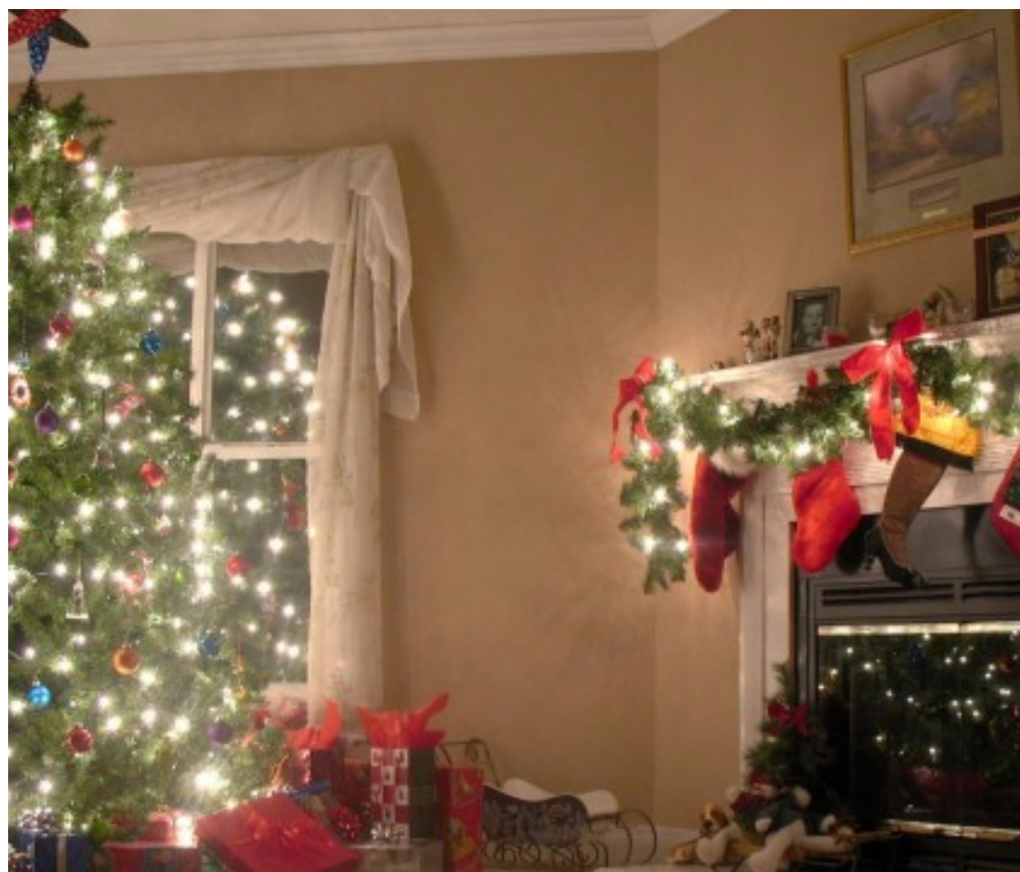
Wesołych Świąt i Szczęśliwego Nowego Roku :)