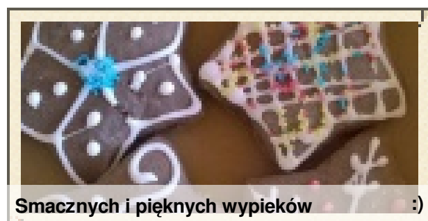
Smacznych i pięknych wypieków