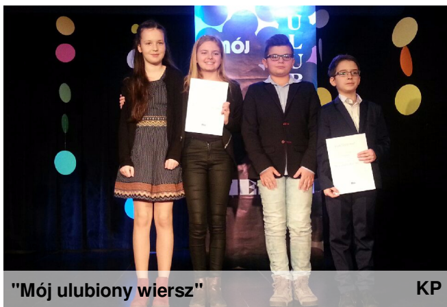
"Mój ulubiony wiersz"