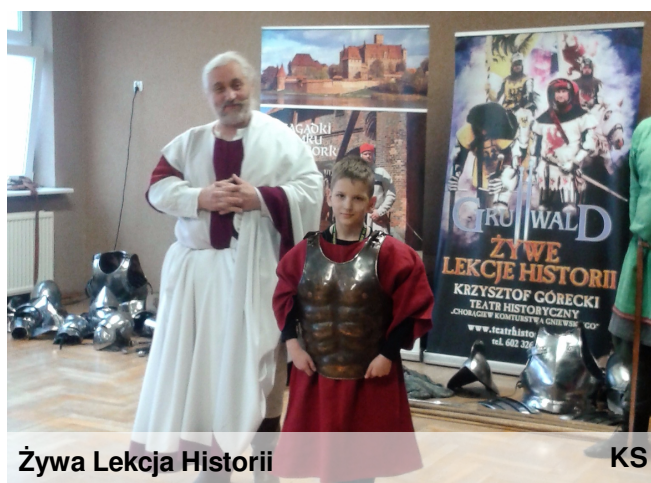
Żywa Lekcja Historii