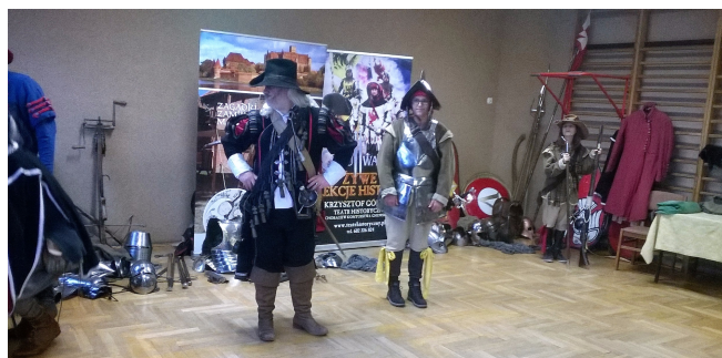
Żywa Lekcja Historii

30 listopada w naszej szkole odbyły się Żywe Lekcje Historii. Gościliśmy Teatr Historyczny "Chorągiew Komturstwa Gniewskiego", który w sposób barwny i ciekawy, z wykorzystaniem rekwizytów z epoki, włączając uczniów do pokazu, zaprezentował trzy lekcje: dla klas 4 - Starożytna Grecja i Rzym, dla klas 5 - Wojowie i rycerze za czasów Piastów, dla klas 6 - Polska sarmacka legenda husarii. Lekcje świetnie zaaranżowane, z dużą dawką humoru, pozwoliły w sposób łatwy i przyjemny "dotknąć" historii.