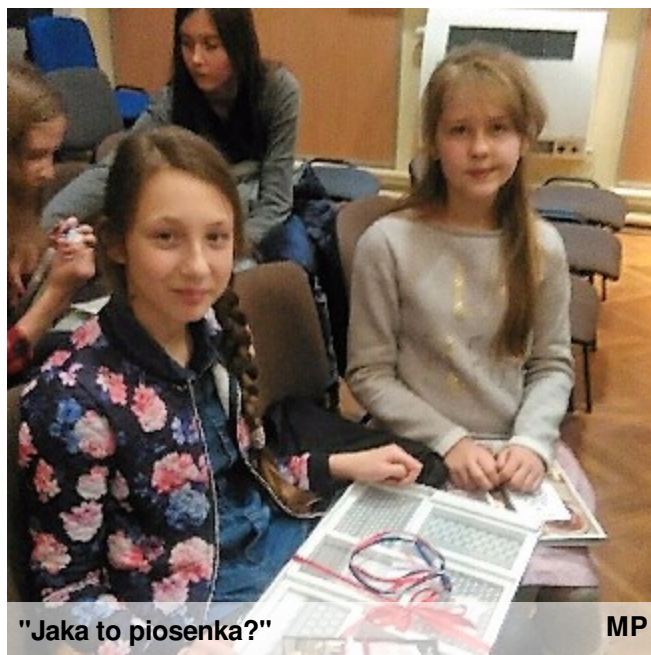
"Jaka to piosenka?"