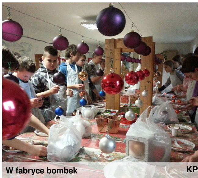
W fabryce bombek

Wielkimi krokami zbliżają się święta Bożego Narodzenia. Magiczny czas rodzinnych tradycji, gotowania wigilijnych potraw, szukania gwiazdkowych prezentów, sprzątania i przystrajania domu. To czas długo wyczekiwany przez wszystkich. Najwięcej radości podczas świąt Bożego Narodzenia sprawia ubieranie choinki. Na zielonych gałązkach pojawiają się różnokolorowe ozdoby. W tym roku uczniowie naszej szkoły zawieszą na świątecznych drzewkach własnoręcznie pomalowane bombki, które wykonali podczas wycieczki do fabryki bombek w Gnieźnie. Udekorują choinkę ozdobami wykonanymi na zajęciach plastycznych zorganizowanych przez pracowników Muzeum Okręgowego w Pile lub na lekcjach plastyki.