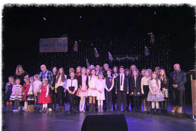
Konkurs Kolęd i Pastoralek