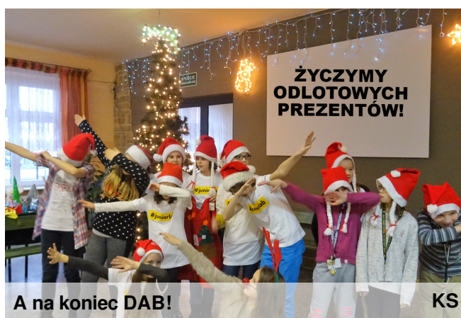
A na koniec DAB!