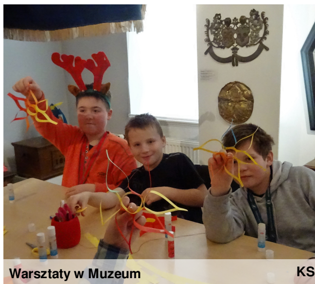
Warsztaty w Muzeum