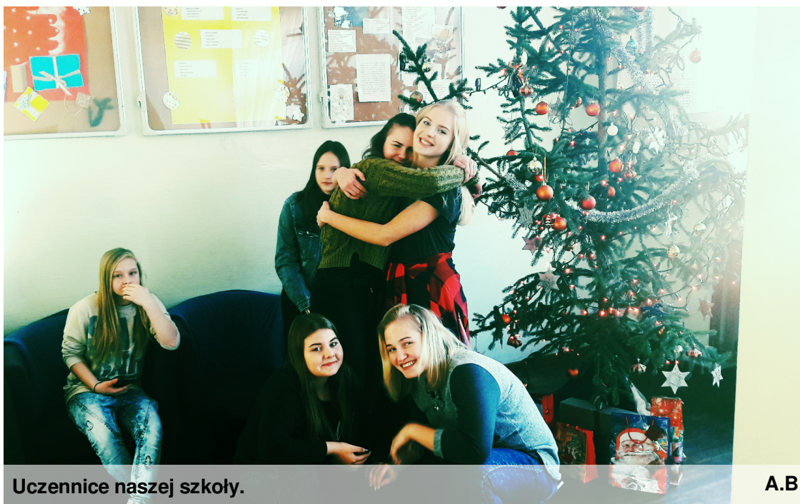
Uczennice naszej szkoły.