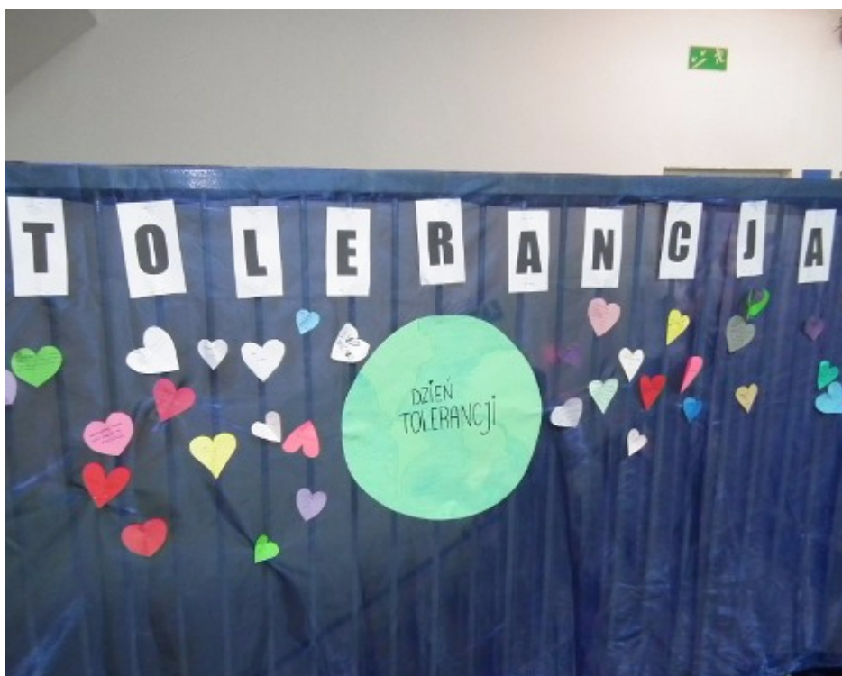
Serduszka „Czym dla nas jest tolerancja?”