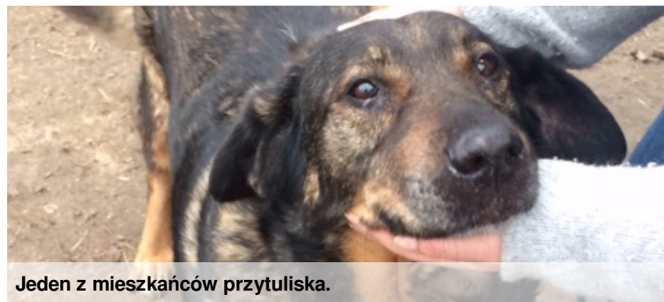
Jeden z mieszkańców przytuliska.