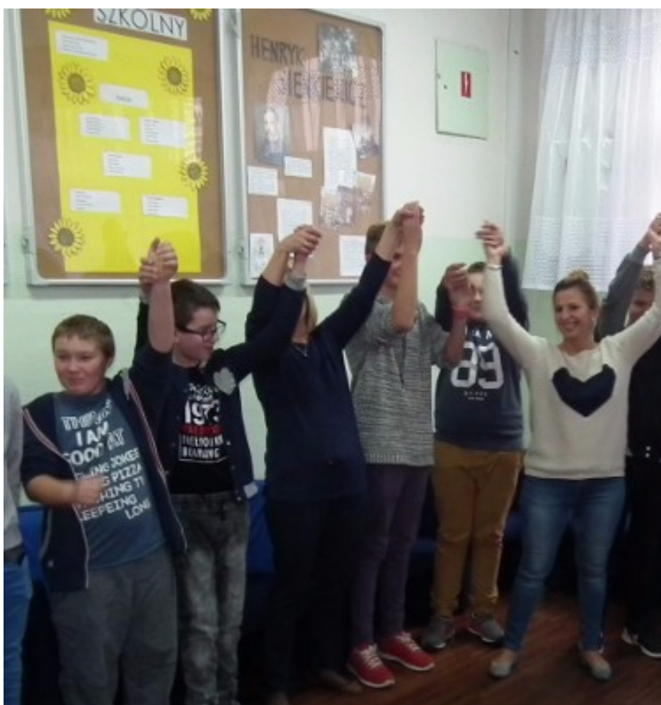
Uczniowie podczas apelu.