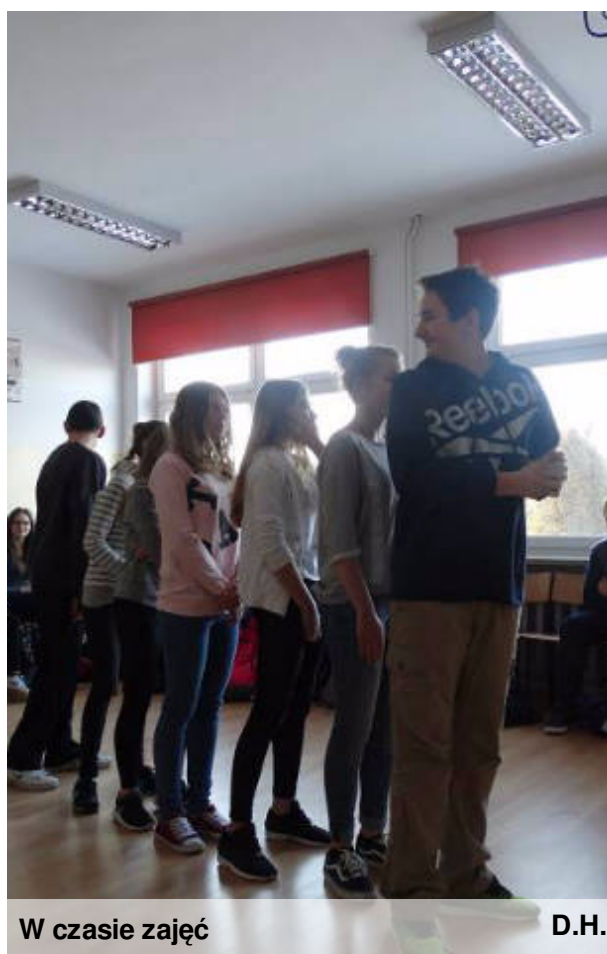
W czasie zajęć