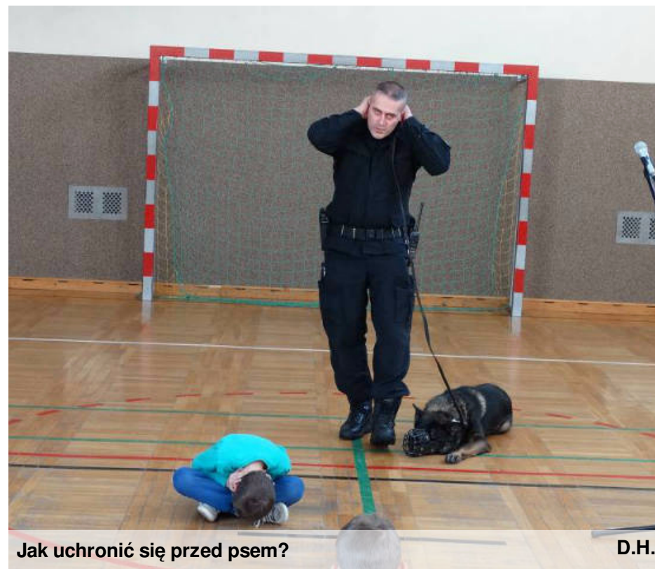
Jak uchronić się przed psem?