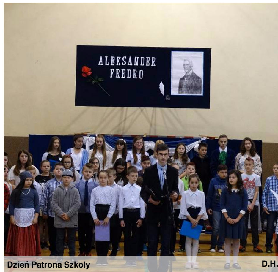
Dzień Patrona Szkoły