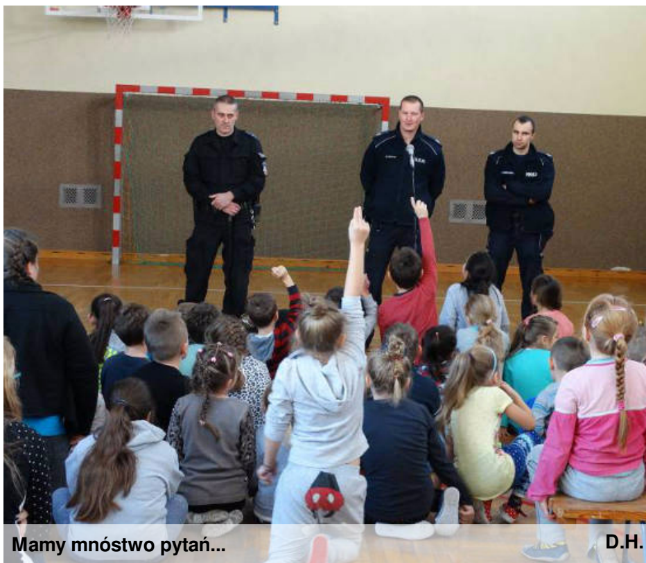
Mamy mnóstwo pytań...