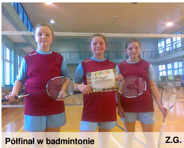
Półfinał w badmintonie